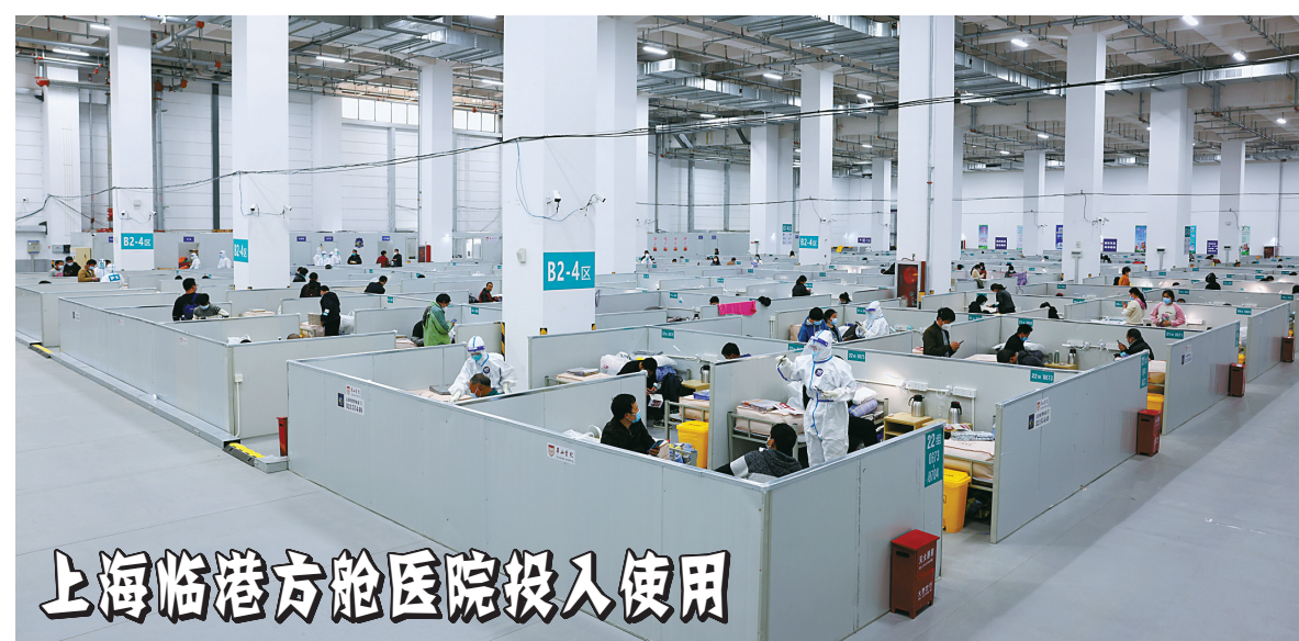
上海临港方舱医院投入使用

31个省（自治区、直辖市）和新疆生产建设兵团报告新增无症状感染者21784例，其中境外输入73例，本土21711例（其中上海19660例，吉林1546例）。