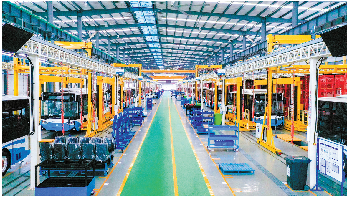
宁波中车产业基地

“我们将全面贯彻落实中央决策和省委部署、市委要求，坚持稳中求进工作总基调，稳步推进‘七创争先’，奋力攀高进位，率先打牢高质量之基、激活竞争力之源、走好现代化之路，实现高质量打造现代化滨海大都市首善之区良好开局。”鄞州区主要负责人表示。