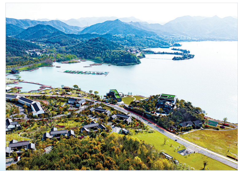
东钱湖乡村振兴绘新篇

今年，鄞州将持续巩固工业制造，推进产业链主体培育和上下游共同体建设，争取创建产业链共同体企业2家，实施新一轮“腾笼换鸟、凤凰涅槃”攻坚行动。深入实施“343”现代服务业倍增发展行动，重点实施“1330”商贸平台提能攻坚行动，即打造全市首家“千亿级”大厦，打造百亿楼宇12幢、百亿特色街区1个、百亿商圈1个，打造税收亿元楼宇30幢。着力打造长三角南翼特色航空物流集聚区，深化政银企协调对接，建立健全普惠金融服务体系。力争全年新增上市企业2家。