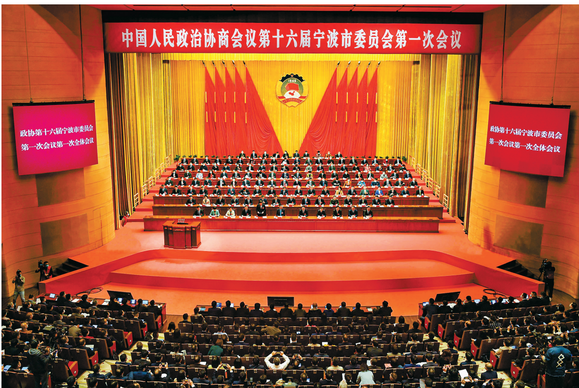
昨日上午，市政协十六届一次会议在宁波文化广场大剧院开幕。