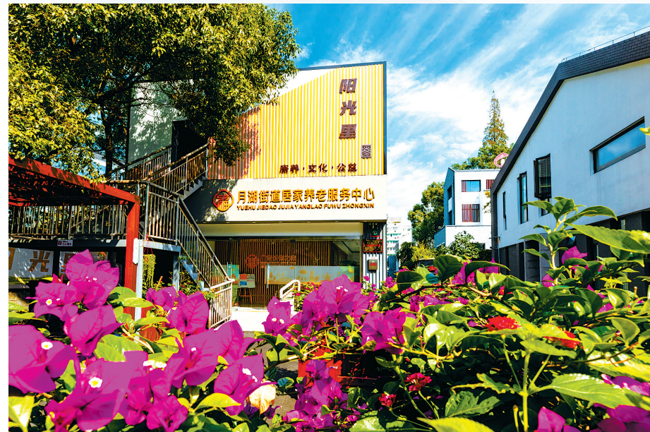
畅享舒适老年生活