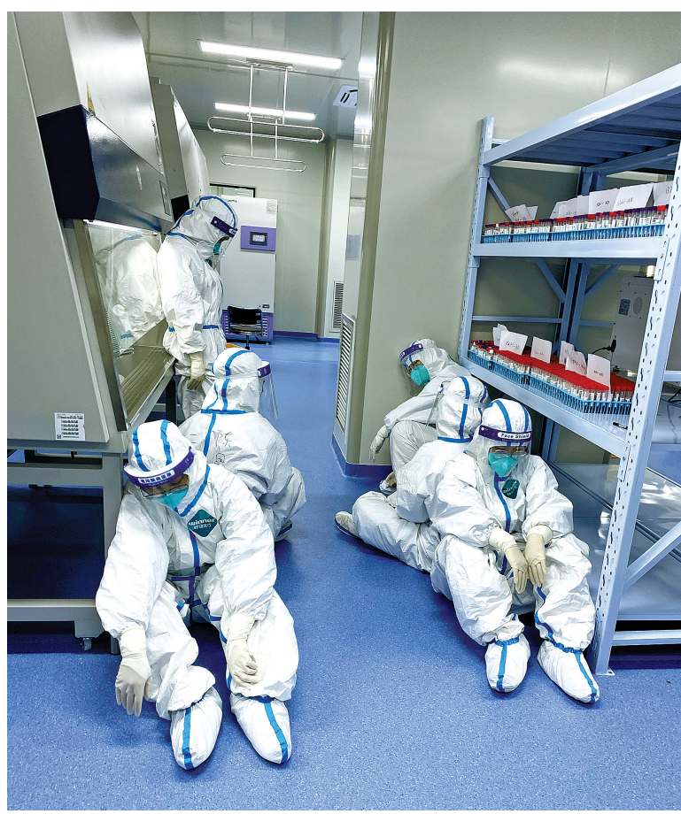
连轴转累倒的核酸检测人员。

他们的常态，身上的汗水是最美的印记。 为保障核酸采样“不漏一户、不少一人”，身穿厚厚防护服的“大白”们经常需要步行、攀爬楼梯，为行动不便的居民上门采样，衣衫常被汗水湿透。“脱下防护服能倒出水来，感觉上门采样的运动量，可以让我瘦好几斤，不需要去健身房了。”海曙区第二医院医务人员周伟打趣道。 为守好疫情防控的第一道关，海曙区第二医院、第三医院医疗健康集团的“大白”们还需前往高速公路出入口处，为来自中高风险地区的人员进行核酸采样，不畏艰辛24小时值守岗位。 为确保核酸检测报告及时、准确出炉，核酸检测人员同样连轴转。鼓楼街道社区卫生服务中心的医务人员林珂霞、丁梦婷自3月30日响应号召以来，一直随着海曙移动核酸检测车工作。随着海曙区核酸检测基地一期的试运行投入，该中心医务人员王毅超于4月9日凌晨进入基地一期，连日来一直奋战在实验室。 时刻待命，随时出发。这是“白衣战士”的工作常态，更是职责与使命所在。核酸采样工作仍在继续，他们将用汗水和毅力，为阻断疫情传播贡献独特力量。