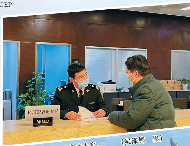
宁波海关设立RCEP咨询专窗。

“在市开放型经济领导小组指导下，进一步发挥RCEP工作专班作用，努力形成全市统一、上下协同、共同推进的工作格局，同时打造公共服务平台，建立集RCEP规则研究、商务数据整理、信息咨询决策、涉外企业服务等于一体的涉外公共服务平台和专家队伍，为企业提供免费服务。此