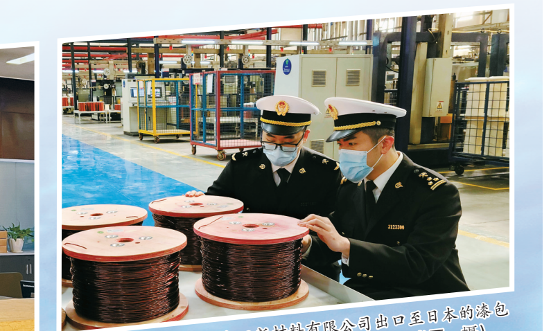
宁波海关为宁波金田新材料有限公司出口至日本的漆包电线签发RCEP原产地证书。

对外投资方面：截至2021年底，我市对RCEP成员国投资额 79.3亿美元 占到全市总量 28.1%