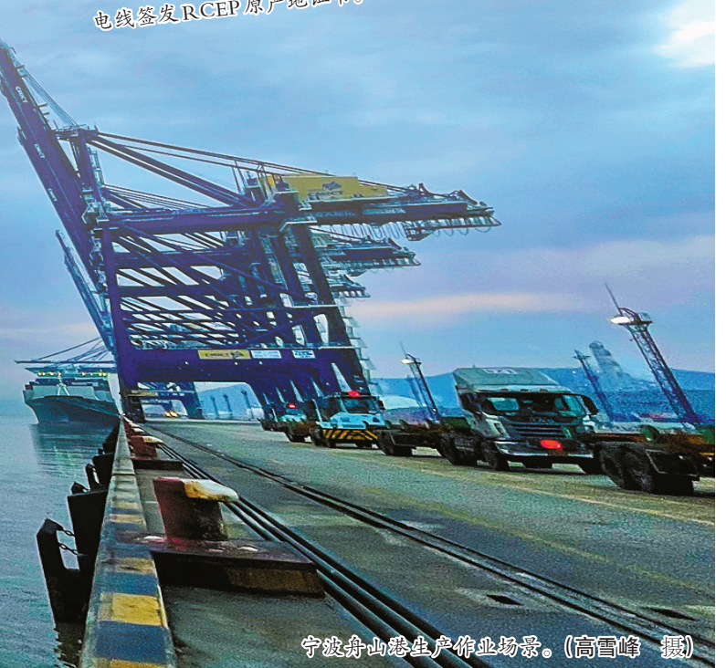
宁波舟山港生产作业场景。