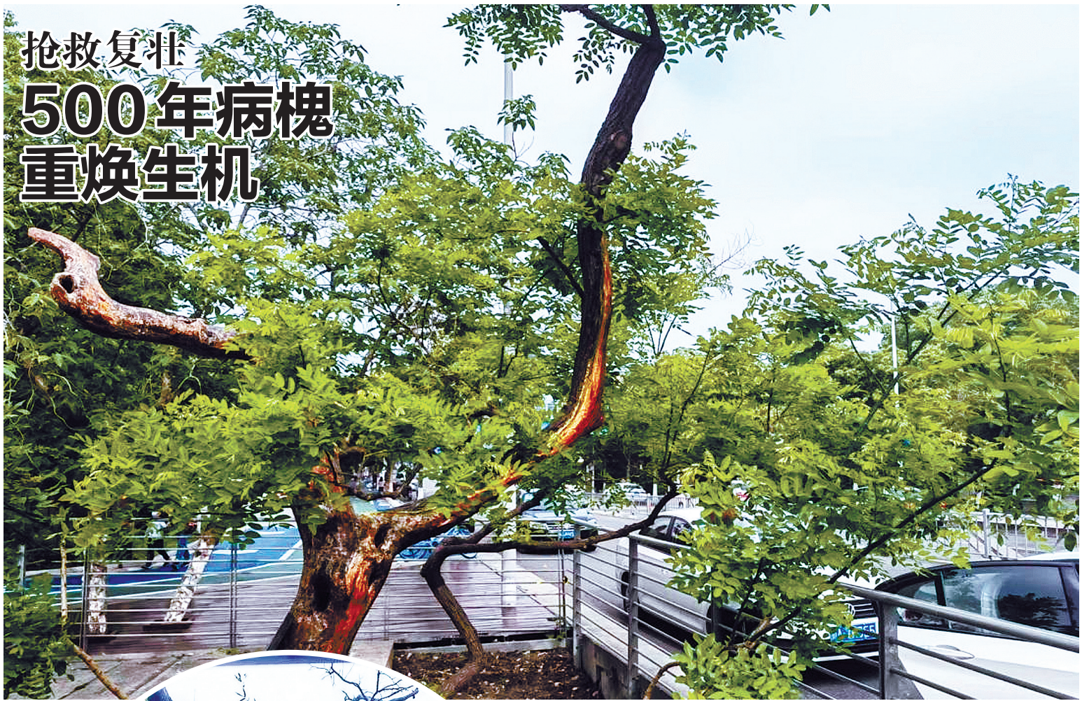
▲重焕生机的古槐树。