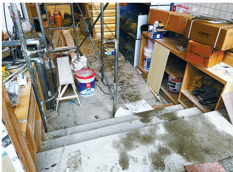
雷公巷53号餐饮店下挖地坪,入店内需下3级台阶。

他说,家庭公寓楼下商舖下挖地坪、拆除预制板未破坏房屋基础、结构安全,暂无隐患。但是,雷公巷53号、彩虹北路109号拆除店内预制板前,未根据有关条例的要求,向他们提出申请,出具有资