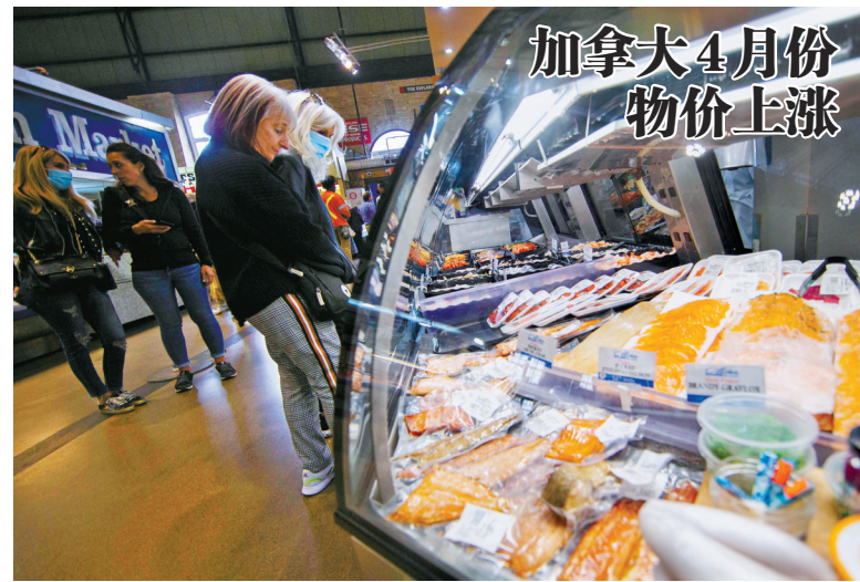
5 月 18 日, 顾客在加拿大多伦多的一家市场内购物。根据加拿大统计局当日公布的最新数据, 加拿大 2022 年 4 月份的消费者价格指数同比增长 6.8%。

美国借“经济合作”之名, 行“排挤他国”之实, 路人皆知。据媒体披露, 拜登此行的重要议题之一是启动“印太经济框架”磋商, 并向地区国家推销具有浓重对抗色彩的“印太战略”。“印太经济框架”是“印太战略”在经济领域的延伸, 目的是把中国排除在其主导的国际供应链之外, 从而遏制中国发展, 延续美国经