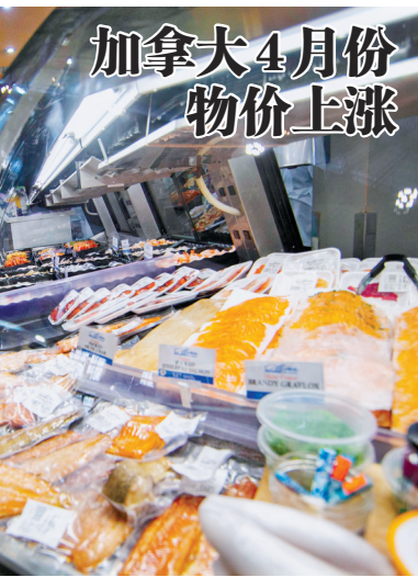
5 月 18 日, 顾客在加拿大多伦多的一家市场内购物。根据加拿大统计局当日公布的最新数据, 加拿大 2022 年 4 月份的消费者价格指数同比增长 6.8%。

美国搞“小圈子”挑动地区对抗, 不得人心。美国把中国视为主要战略竞争对手和“假想敌”, 渲染所谓“中国威胁”, 固守冷战思维和“零和博弈”心态, 强迫盟友“选边站队”, 不惜一切代价压制中国的战略发展。无论是“印太经济框架”“印太战略”, 还是“四边机制”“三边安全伙伴关系”, 本质上都是美国在蓄意制