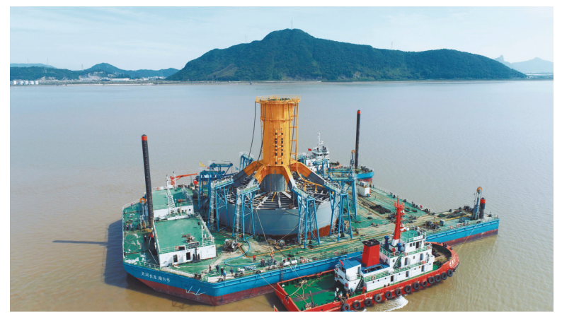
图为两艘拖轮与“天河长龙-南方号”绑定。

本报讯（记者董娜 通讯员麻宏宇 王奕凯）5月19日，我国首创筒型基础专用浮运平台“天河长龙-南方号”在海巡艇的护航下，顺利离开宁波象山港，前往广东珠海桂山海上风电项目，并将应用于海上风力发电塔基础的浮运和安装下沉辅助，升级服务国家新能源开发。