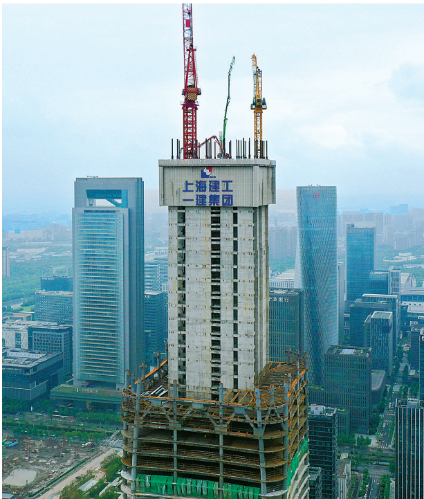
宁波中心大厦。

“目前宁波中心大厦处于结构施工高峰期，核心筒达到56层，外框钢结构也在攻克38层到39层的第二道桁架层，砌体施工至29层。根据计划，今年年底完成核心筒结构封顶，项目整体将在2024年年底实现竣工。”宁波中心大厦建设发展有限公司总经理忻旭伟介绍。