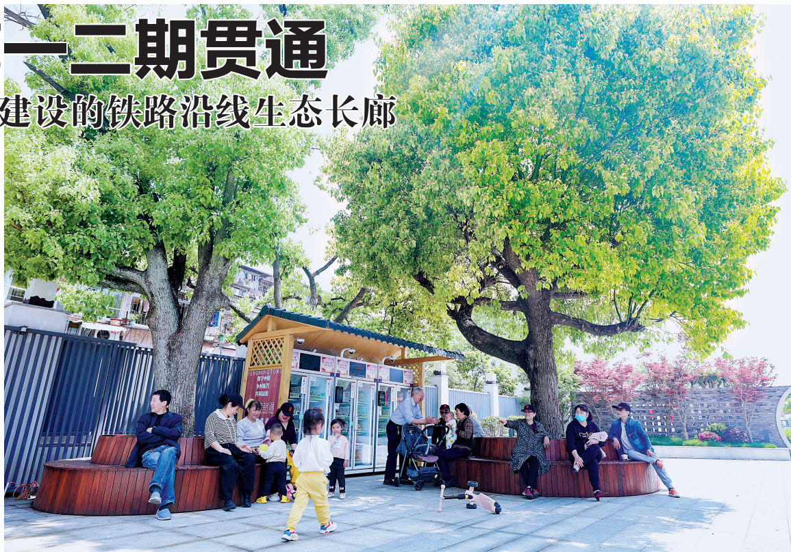
附近居民在大樟树下休闲。（郑瑶 王博 摄）

新建成的甬西走廊二期聚焦“一老一小”。大樟树下，老年人可以看戏、聊天，听着蝉鸣纳凉；“中央厨房”每天可将营养套餐送达有需要的老人家里；蒙