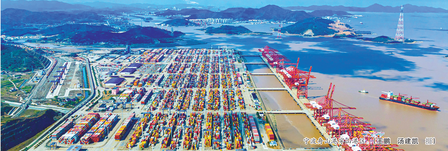
宁波舟山港穿山港区。