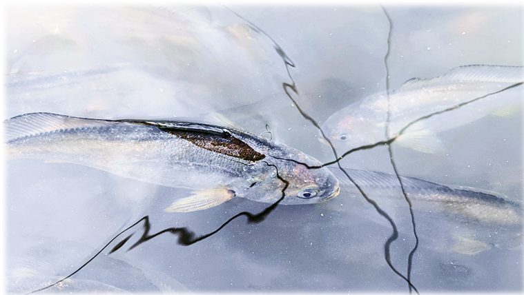
耐低氧大黄鱼子二代鱼苗。