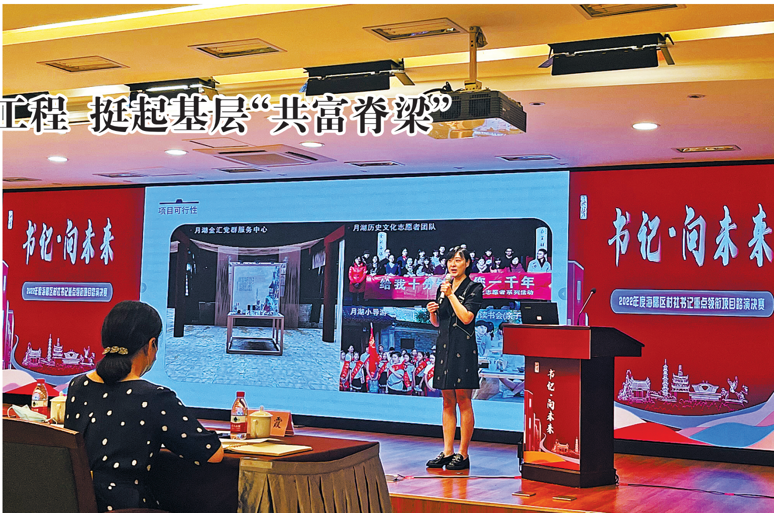
“书记·向未来”项目擂台赛活动

为了推动村社“领头雁”精准学习、学以致用，海曙共富头雁研学院专门实施锋领头雁共富