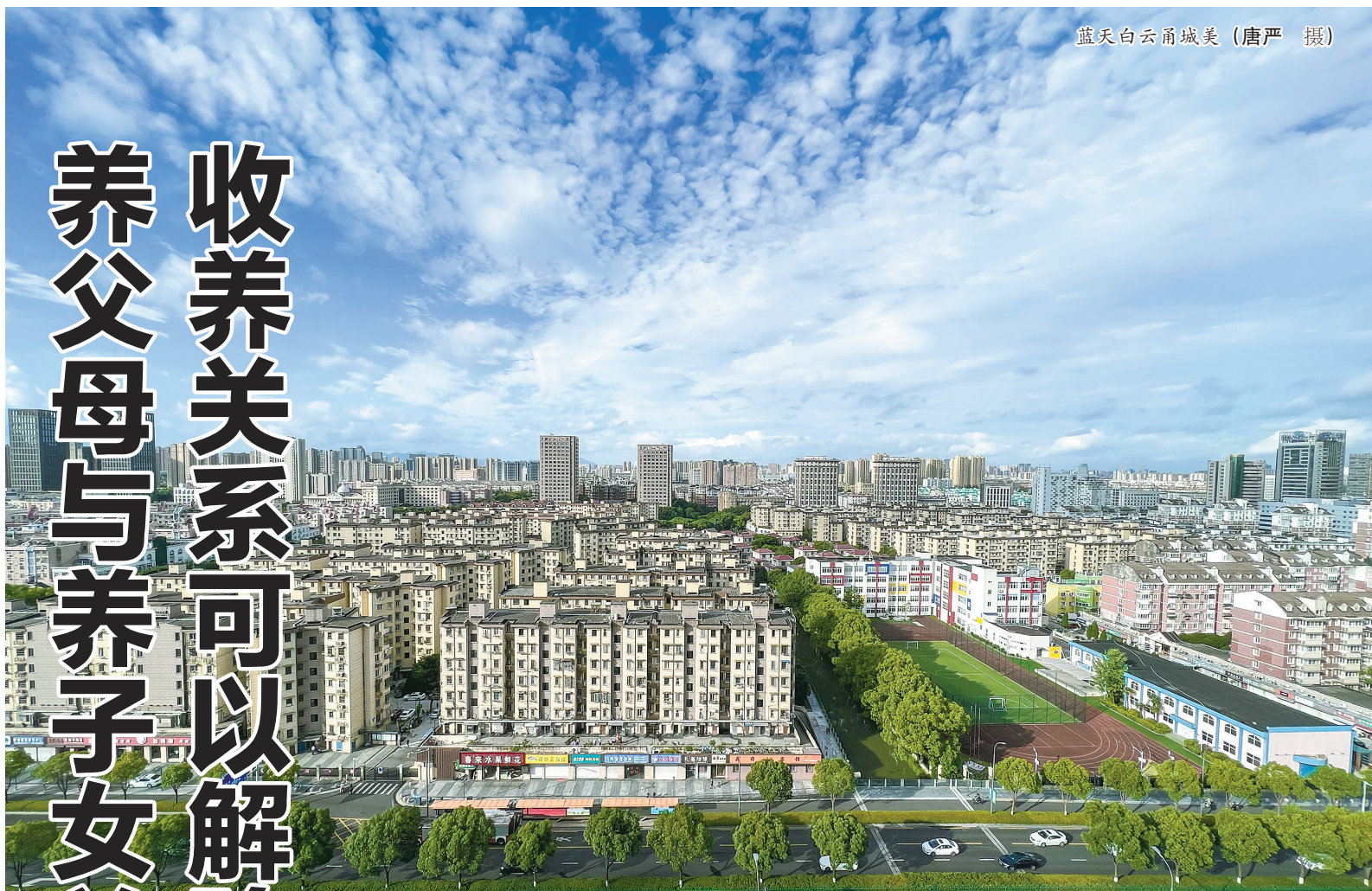
蓝天白云甬城美