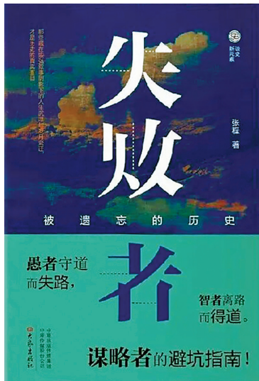
失败者：被遗忘的历史

书中所有的业余文保员风采惜未道尽，不过43篇文章的题目均为七字，如诗句，连起来念，朗朗上口。有句话叫“生活不止眼前的苟且，还有诗和远方”。我想，这远方，就是家乡的文保事业自有后来人。