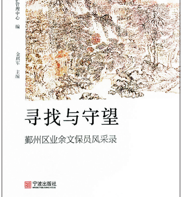
寻找与守望 鄞州区业余文保员风采录

整整45个春秋，从7人成团发展到200多人的一支队伍，他们中，有家庭传承的，有好友接力的，有师徒帮带的，有的文保员已是第三代，日积月累使文化自觉蔚然成风。“随风潜入夜，润物细无声”，文保工作在鄞州大地得到了普遍的重视，亦可见敦厚、善良、淳朴、向美的乡情。