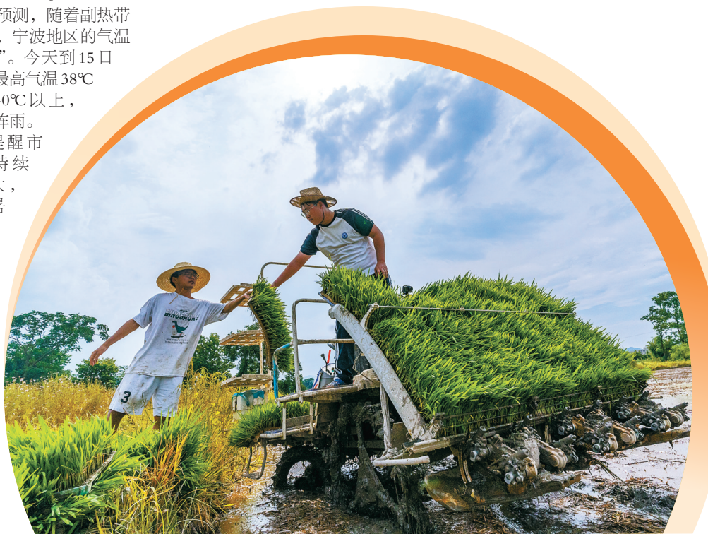
眼下正值夏收复种时节，各地农户辛勤劳作，为丰收打下良好基础。图为海曙区洞桥镇宜裘村的农户顶着烈日，驾驶插秧机下秧栽种。

“中午还是不回家了，在驿站里稍微休息下。一会儿也点份外卖，算是解决一餐。”孙磊抹了把脸上的汗水，笑得有些腼腆。