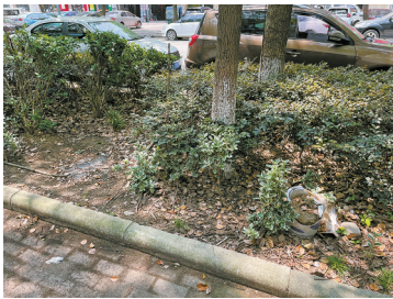
绿化带里被人踩出的小路。

但7月24日,记者在现场看到,路面垃圾虽已清理,但人行道上的绿化依旧破败不堪,绿化带里各种