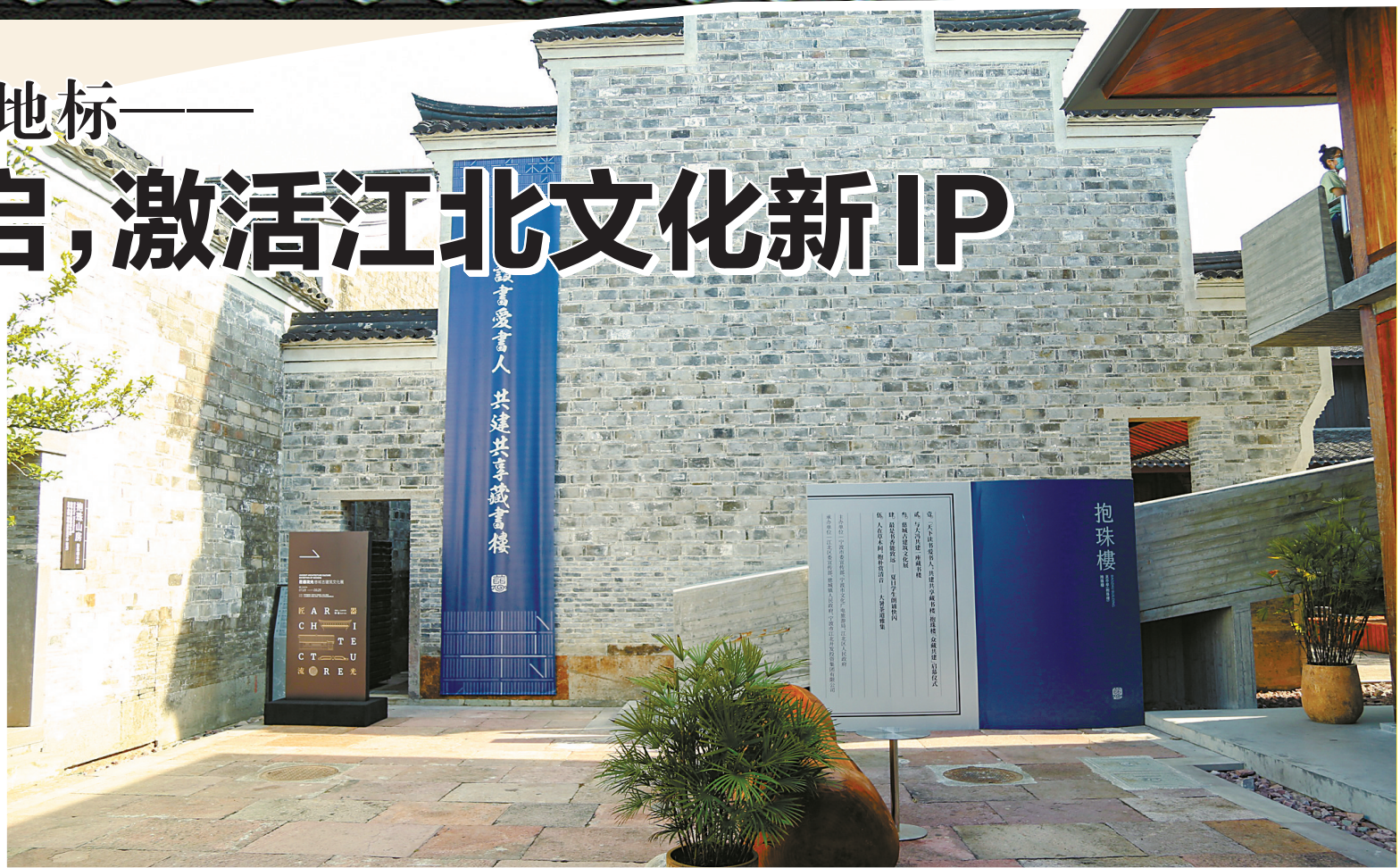
抱珠楼内景。

抱珠楼重启，不仅让“书香宁波”再添一处文化新地标，也成为宁波活化利用历史文化遗产的良好范本。相信在未来，抱珠楼在传承优秀传统文化、激活文化新IP中将继续发挥不可替代的作用。