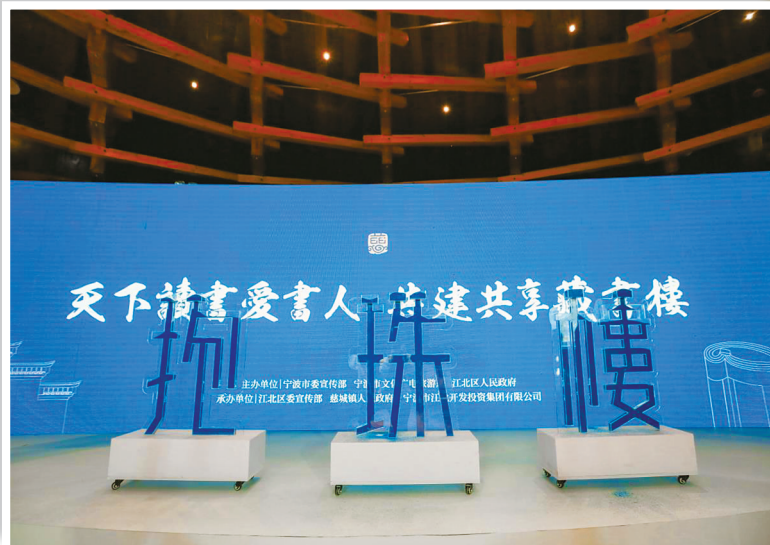
抱珠楼开馆仪式现场。

抱珠楼拂尘而出、重启面世，以崭新的姿态再出发，这不仅唤醒了老宁波人共同的书香记忆，也将为“书香宁波”建设贡献一份力量，打造一张文化发展的金名片。