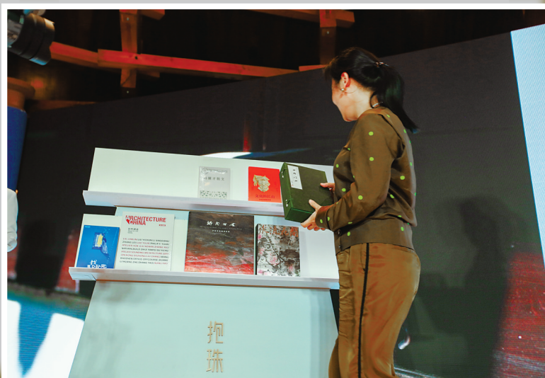
文化艺术界人士为抱珠楼捐赠签名本。