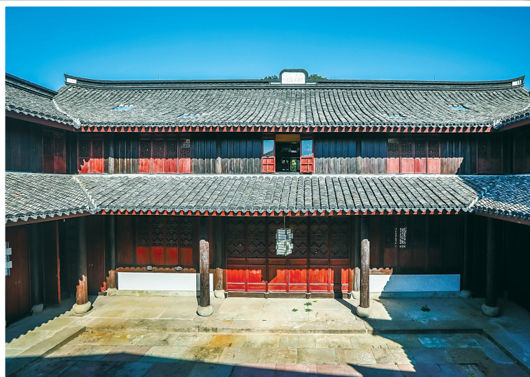
抱珠楼焕发生机。