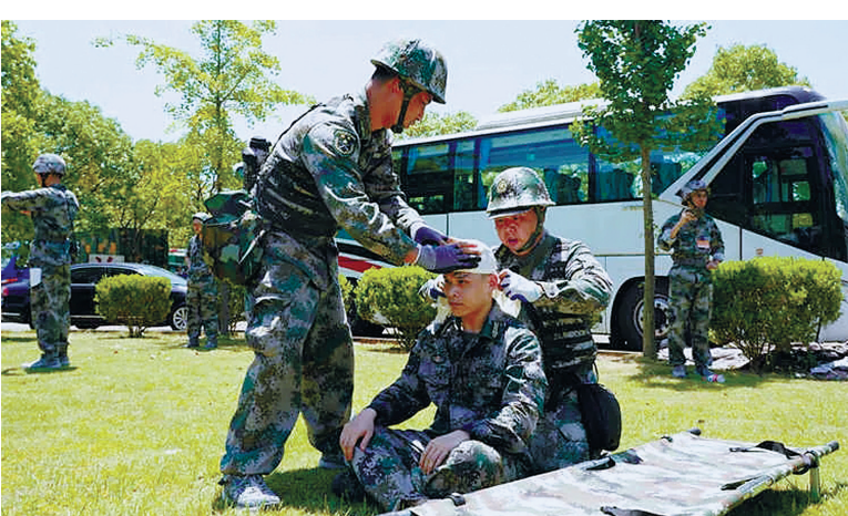
战场救护比武

“这次比武，是贯彻习主席训令、掀起群众性练兵热潮的生动实践，是提振官兵军心士气，提升部队凝聚力、战斗力的重要举措，也是民兵分队精神风貌的一次大展示。”宁波军分区司令员沙忠明在总结讲话中表示，“比武不是真正的目的，以比促训、以比促备才是根本，提高后备力量遂行应急应战使命任务能力，服务打赢战争、支援地方建设才是根本，在列的各位民兵要把比武中展现出的敢打胜仗的决心、勇夺第一的魄力，持续运用到实际行动中，为服务强军兴军事业做出更大贡献。”