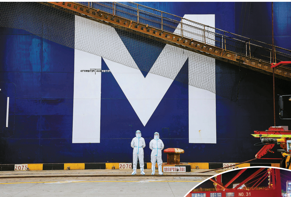
执勤民警对靠泊作业的外轮进行港口监护

“1958年，一大批风华正茂的年轻人，怀着同一个梦想，汇聚到海岛梅山，投入到创业的洪流中”，这是写在梅山盐场纪念馆内的话语，故事激励着执勤八队的全体民警，如今的梅山正进入发展的快车道，该队民警将继续肩负起他们的责任，传承部队优良作风，在国门口岸书写属于他们的青春故事。