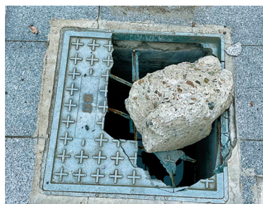
▲方桥地铁站A出口外的破损窨井盖。

欢迎广大市民继续通过以下渠道投诉举报身边的存在问题。经宁波民生e点通平台反映的问题，将通过市有关部门的数字化指挥应