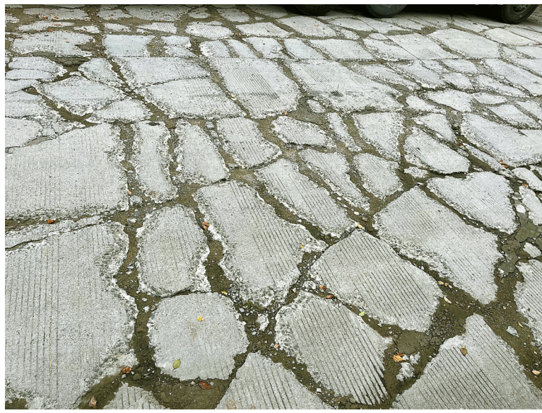
人行道也破损不堪，部分路沿已经被压塌。

14时，记者在镇海聚源路上看到，整段道路破损十分严重，路面严重开裂，几百米长的道路上分布着大小上百条裂缝，部分位置的裂缝已呈现鱼鳞状。另外，该路的