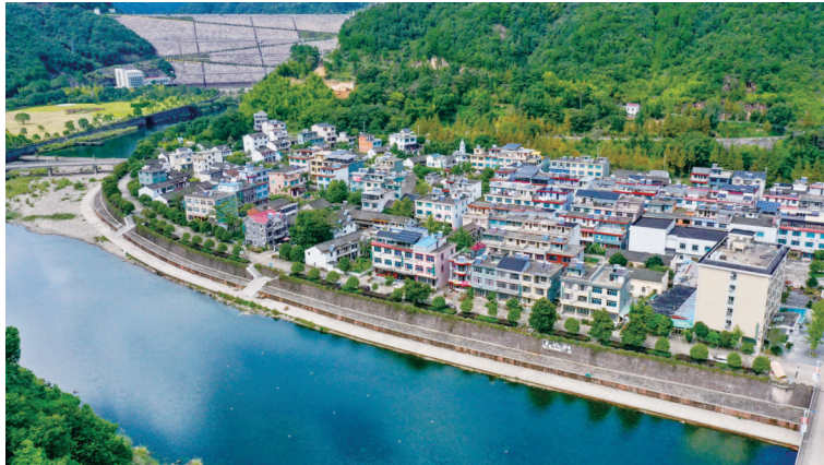
白溪沿岸的省级民宿聚集村岔路镇天河村。