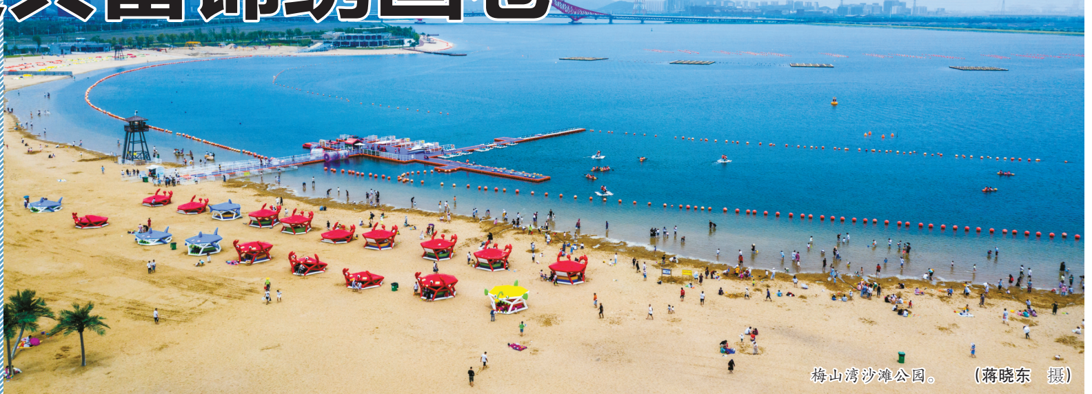
梅山湾沙滩公园。

2016年,宁波在全省率先实施“污水零直排区”创建工作;2018年,宁波在全省率先启动智慧水利建设项目,并于2020年3月入选全国智慧水利先行试点城市;2018年至2021年,全市共有56条河湖创建为市级“美丽河湖”,其中44条被命名为省级“美丽河湖”,同时创建了30个“美丽水乡”和100个“水美村庄”……近年来,随着“五水共治”工作深入推进,宁波水清岸绿的美景再现,生态好,水质优,百姓因水得福,走上共富新路,一幅“河、湖、海”绿色发展的美好生态画卷正在徐徐展开。