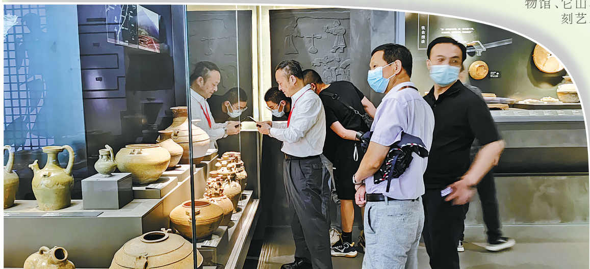
市民参观“山海交响——奉化历史文明展”。