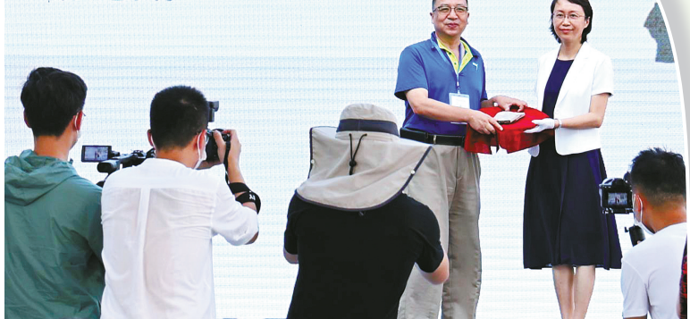
周尧昆虫博物馆新馆开馆当天收到珍贵礼物——距今1.6亿年的侏罗纪时代的昆虫化石标本。

这些化石来自于侏罗纪时代的内蒙古，距今已有1.6亿年的历史，具有重要的科学研究意义。