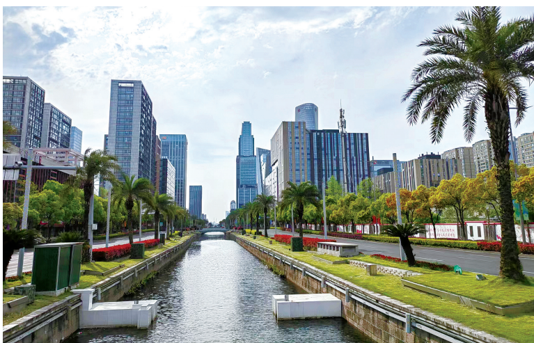
东部新城河清路风光

东部新城有海晏、河清两干路，取自成语“海晏河清”，寓意大海平静，天下太平。自北而南，分称海晏北路、海晏南路、河清北路、河清南路。海晏北路有地铁1号线和5号线交汇而过，为现东部