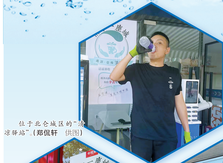
位于北仑城区的“清凉驿站”。

如今，连地铁也分车厢控温。随着城市治理越来越精细化、人性化，送清凉、送温暖也会越来越常态化。正是这点点微光，共同推动了整座城市文明程度的提升。