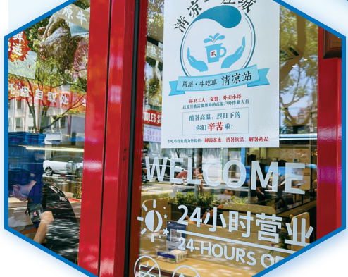
牛吃草连锁餐饮“清凉驿站”。