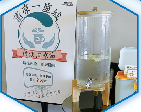
第六空间中央商场“清凉驿站”。