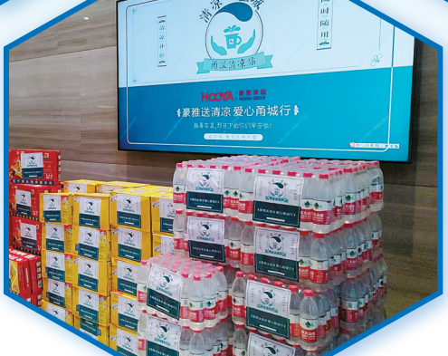
豪雅集团响应倡议“送清凉”。