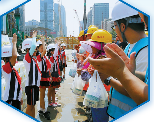
甬派小志愿者给地铁建设者“送清凉”。