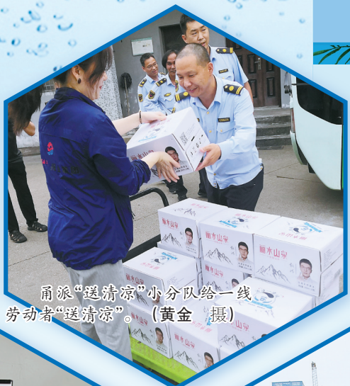
甬派“送清凉”小分队给一线劳动者“送清凉”。