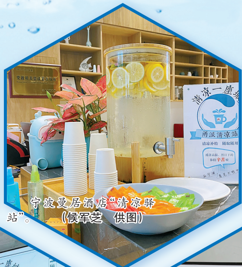
宁波曼居酒店“清凉驿站”。