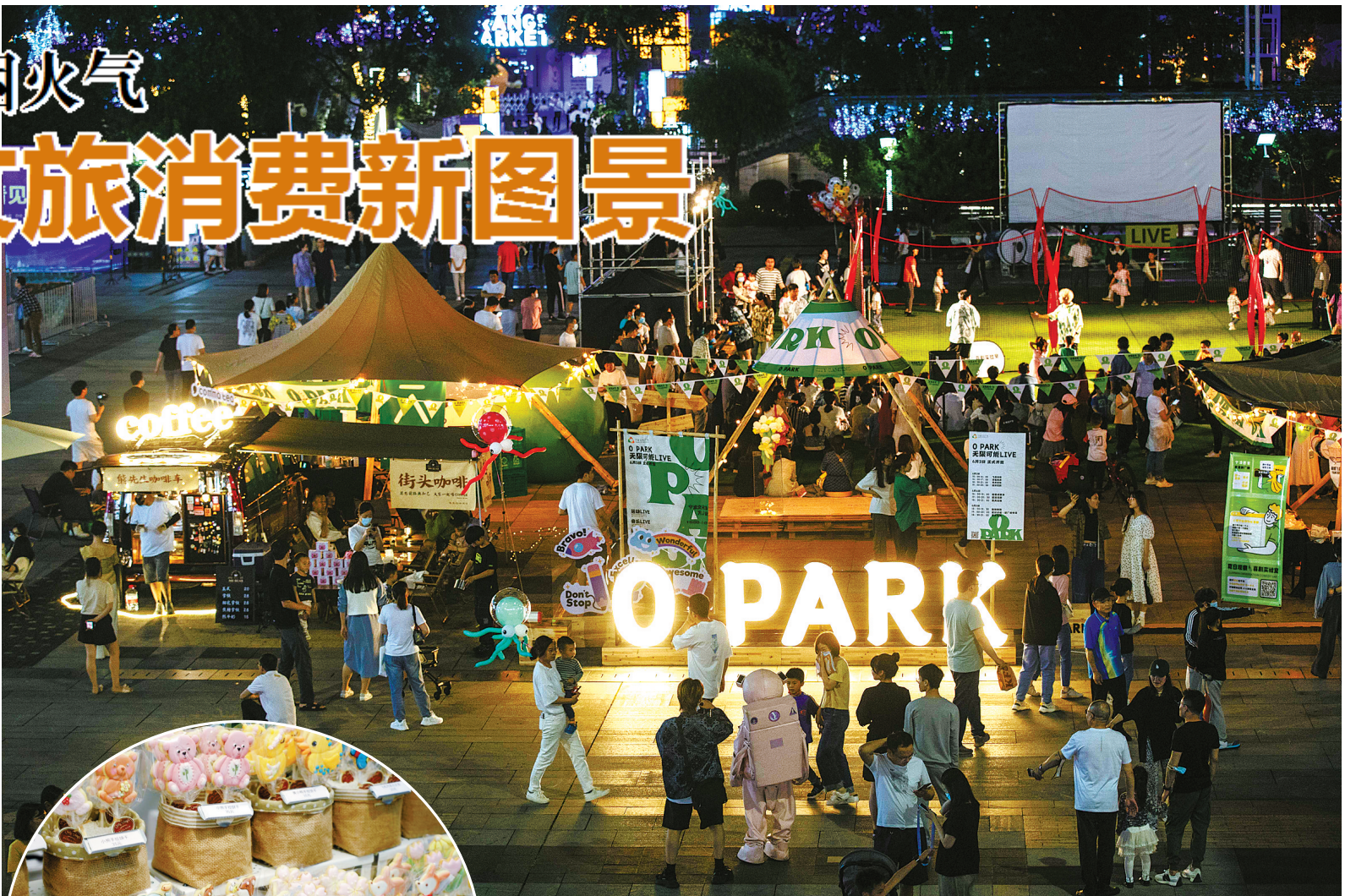
宁波文化广场OPARK项目将飞盘和户外运动项目引入现场，打造户外运动爱好者在城市的集结地。

江北区升级夜间经济消费路径，大力推进“旅行社+景区村”运营模式。作为宁波市唯一的国家级产业融合示范园，达人村田园综合体立足自身特色资源优势，启动