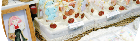
带梦胡同“双手做工”市集，吸引杭州摊主前来摆摊。

“乐活江北”春夏灯光节之田园星空秀，至今已接待游客近10万人次，实现营收超500万元，同比增长200%。