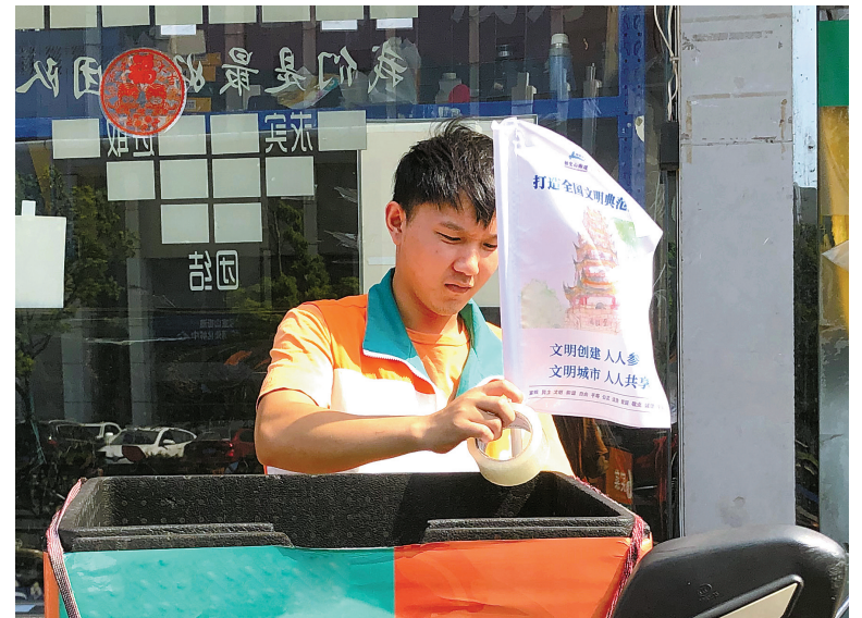
骑手小哥在外卖箱上绑贴文明创建宣传旗。

“我们首批投放了500余份食品安全封签和文明创建宣传旗，希望借此动员更多的市民一起参与全国文明典范城市创建，让文明新风吹遍每一个角落。”招宝山街道相关负责人说。