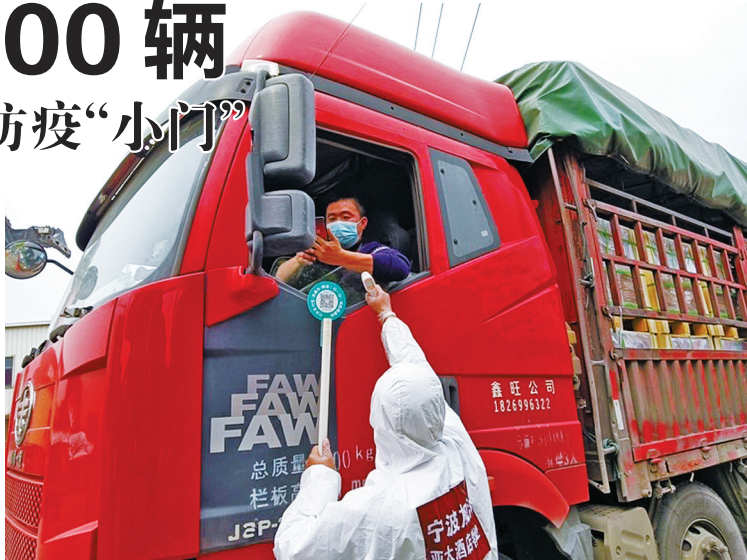
“守门员”正在扫码测温。

据悉，北仑霞浦街道物流园区占地3.5平方公里，日均进入园区的集卡车有7000辆。为了全面、精准地落实集卡司机疫情防控工作，守好物流“小门”确保运输行业安全有效运转，由物流园区党委牵头、“两新”党组织共同参与的“锋领物流”党建联盟发挥了至关重要的作用。