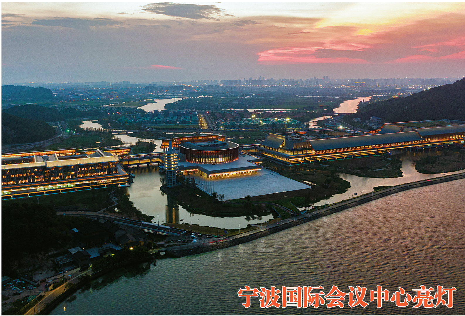
宁波国际会议中心亮灯

宗旨,以“优惠大众,便民出行”为理念,市文旅集团创新推出公园(景区)年票和文旅生活卡。其中,文旅生活卡由文旅板块和生活板块两部分组成,涵盖宁波、温州、绍兴等八地56家景区门票及高尔夫体验、酒店自助餐等权益,仅售399元。我市还实施网红品牌推广计划,在全市遴选出“十大网红打卡地”“十大网红畅销品”“十大网红热门事”,并在线上线下作了全方位的宣传推广。数据显示,今年宁波文旅惠民消费季话题营销点击量突破400万人次,直接带动文旅消费超3000万元。“当下,‘80后’‘90后’已经成为文化消费的重要力量,市民文旅消费习惯改变以及消费场景的迭代升级,为文旅消费增长提供了新的空间。”市文化广电旅游局产业发展处有关负责人表示,我市将继续采取措施,进一步激发文旅消费潜力,推动线上与线下并行发展,激发消费“生命力”,点燃城市“烟火气”。