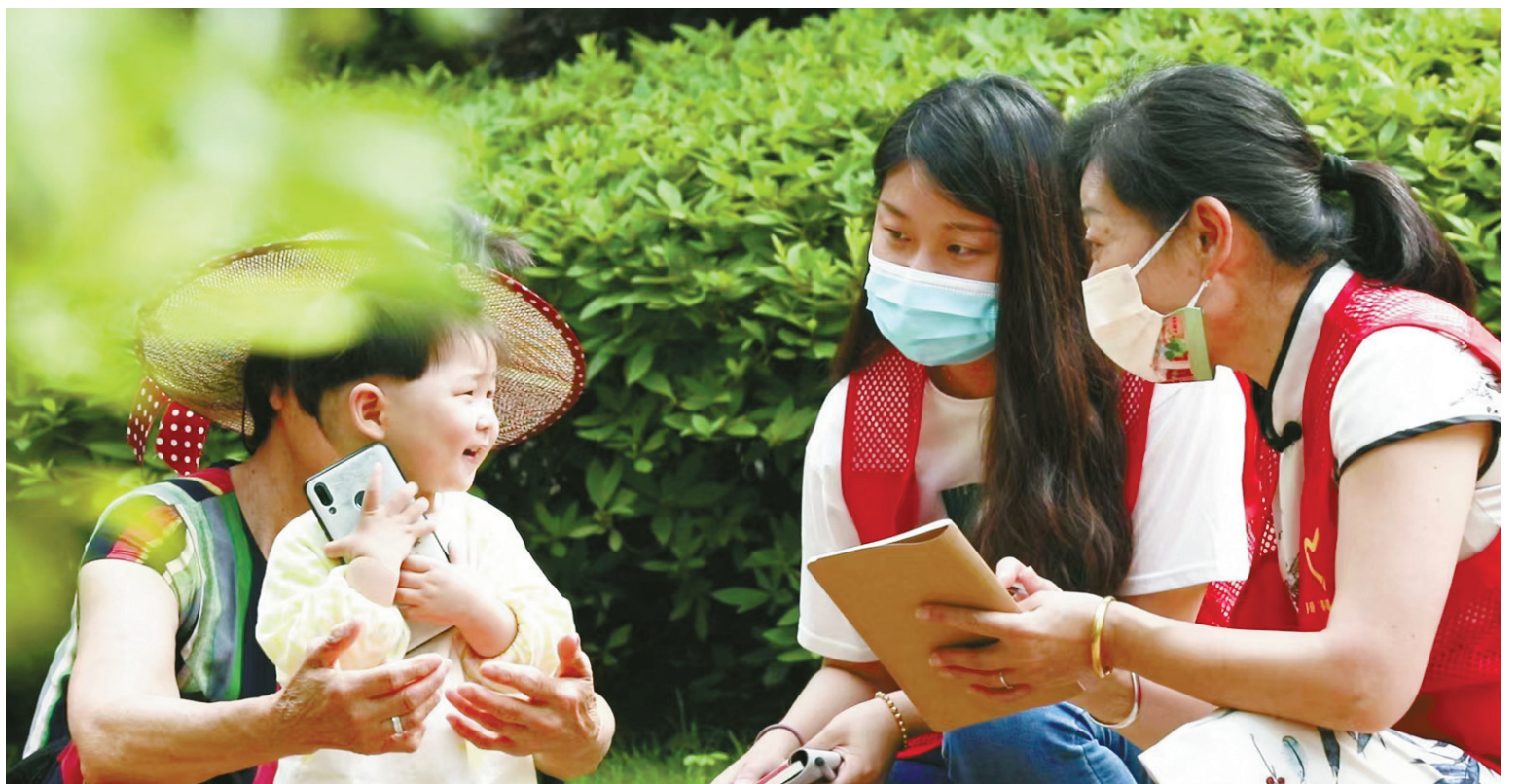
▲宁波市纪检监察系统深入开展漠视侵害群众利益问题专项治理,大力推动解决群众“急难愁盼”问题。图为北仑区纪委监委依托“网络廉盟”机制,深入社区倾听群众意见诉求。