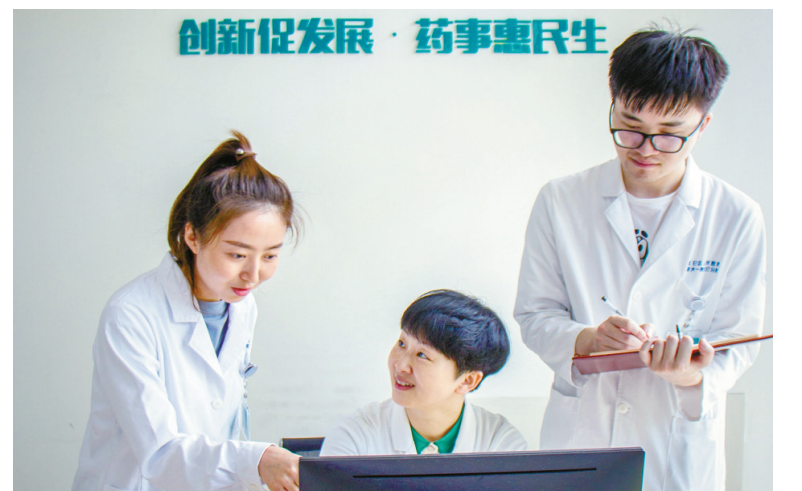
▲北仑区纪委监委聚焦医疗系统腐败现象易发多发的药品采购和使用领域,督促相关单位加强监管。