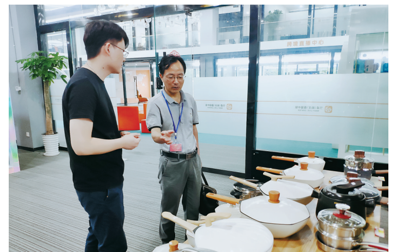
▲江北区纪委监委聚焦网络直播营销行为规范不明、约束不够等问题强化监督,对直播市场主体敲响合规经营的“警钟”。

改。确保整改到位,加大监督执纪力度,健全常态长效监管机制,促进取得网络直播营销领域“不敢违法”“不能违法”“不想违法”的治理效果。”市纪委监委相关负责人表示。