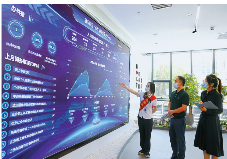
▲镇海区纪委监委组成明察暗访组,采取突击检查、大厅走访、个别访谈等方式,对行风方面专项整治落实情况开展监督检查。