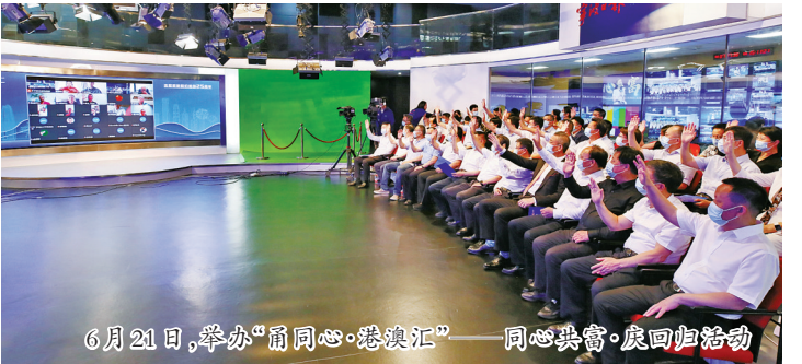
6月21日，举办“甬同心·港澳汇”——同心共筑·庆回归活动

帮”和帮宁波人士来甬投资创业发展，助力宁波加快打造“六个之都”。充分发挥世界“宁波帮·帮宁波”发展大会、浙江宁波“侨梦苑”、宁波市阳明文化海外传习基地等平台作用，有效探索数智化、云平台等方式，促进新时代“宁波帮”线上线下互联互通。广泛调动“宁波帮”资源优势，推动甬港合作示范区、“宁波帮”文化核心区的规划建设，聚力打造港澳合作创新品牌“甬同心·港澳汇”，促进“宁波帮”精神创造性转化、创新性发展。