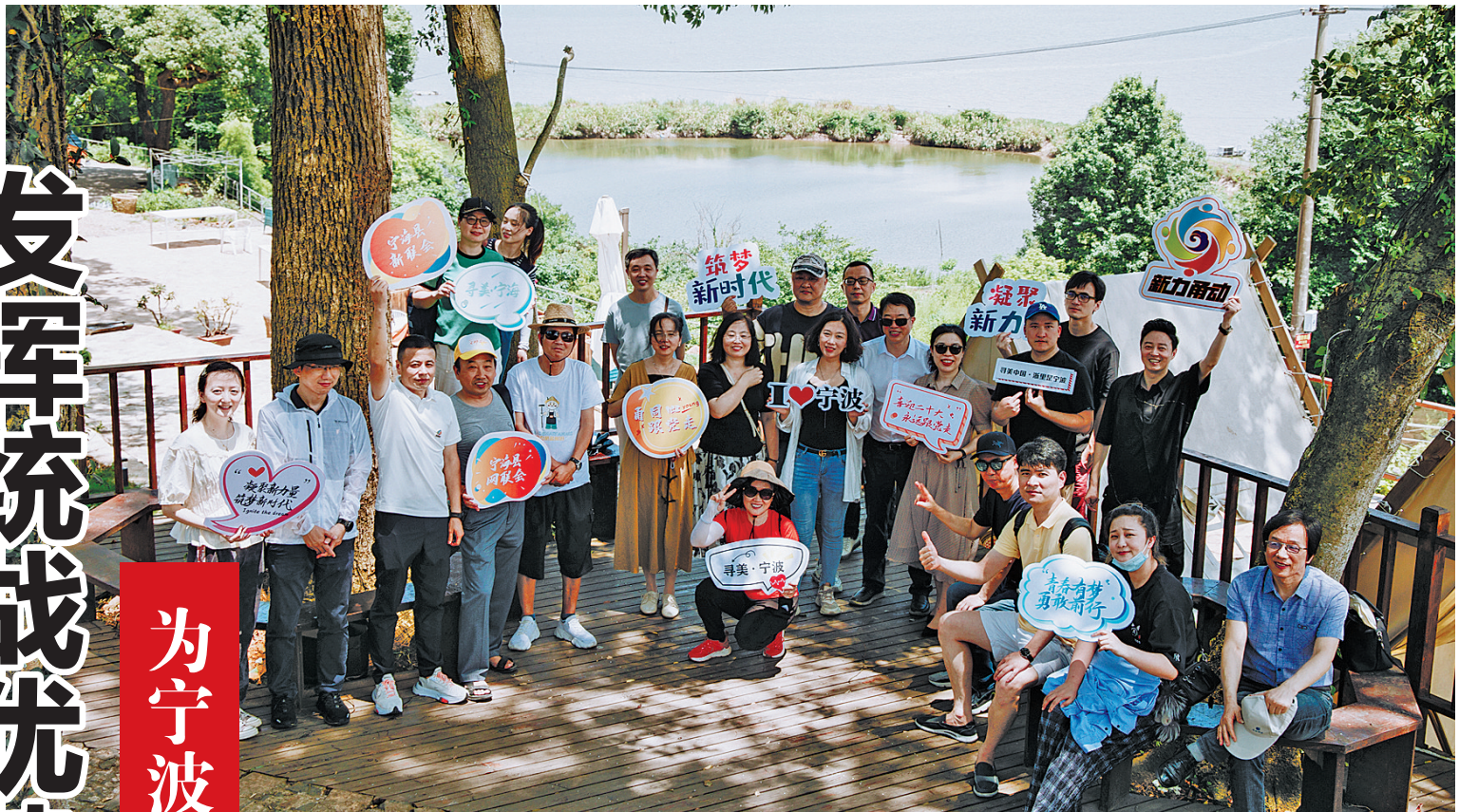
7月，“甬同心·跟党走”2022年新的社会阶层人士“寻美·宁波”主题活动启动