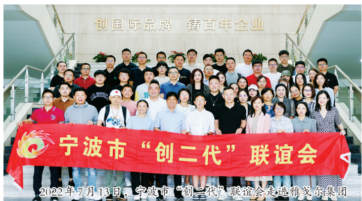
2022年7月13日，宁波市“创二代”联谊会走进雅戈尔集团

飞跃的行动计划，深入实施甬商青蓝接力工程和甬商回归工程，成立“8090新生代甬商青蓝宣讲团”，打造新时代民营经济高质量发展新高地。推动“三服务”“三为”工作迭代升级，助力民营经济稳进提质。持续开展“问千家进百企”走访调研，牵头举办“亲清直通车·政企恳谈会”20余次，常态化搭建政企沟通服务平台，当好民营企业的“贴心人、娘家人”。持续构建亲清政商关系，进一步推进“亲清家园”示范基地标准化建设，完善“亲清健康指数”综合评价，启动建设清廉民企数字化应用场景，助力打造营商环境最优市。