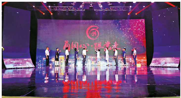
2022年7月15日，举办“甬同心·跟党走”喜迎党的二十大主题活动，活动现场发布了“甬同心·跟党走”宁波市统一战线思想政治引领品牌LOGO

聚焦“五问五破、五比五先”机关作风建设专项行动要求，以“争当先行示范、争当统战能手、争当履职先锋、争创一流业绩”为主要内容，开展“四争”专项行动，全面提升统战机关干部的干劲、拼劲、闯劲，助力打造引领型、力量型、变革型、开放型“四型”统战。