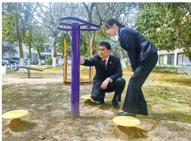
2022年3月，象山县检察院对公共健身器材老化锈蚀、标识不全不清等整改效果开展公益诉讼“回头看”。

5年来，全市检察机关努力以跟进监督督促落实。牢固树立“诉前实现保护公益目的是最佳司法状态”理念，对每一件诉前检察建议案件，做到事前有沟通、事中有互动、事后有跟踪，积极赢得行政机关的认同与支持，检察建议行政机关按期回复率保持在96%以上。开展常态化“回头看”，对检察建议未采纳或者整改不到位的，当诉则诉。起诉的全国首例海域监管行政公益诉讼案，行政机关最终对2名违法行为人作出要求恢复海域原状以及1.23亿元罚款的行政处罚。