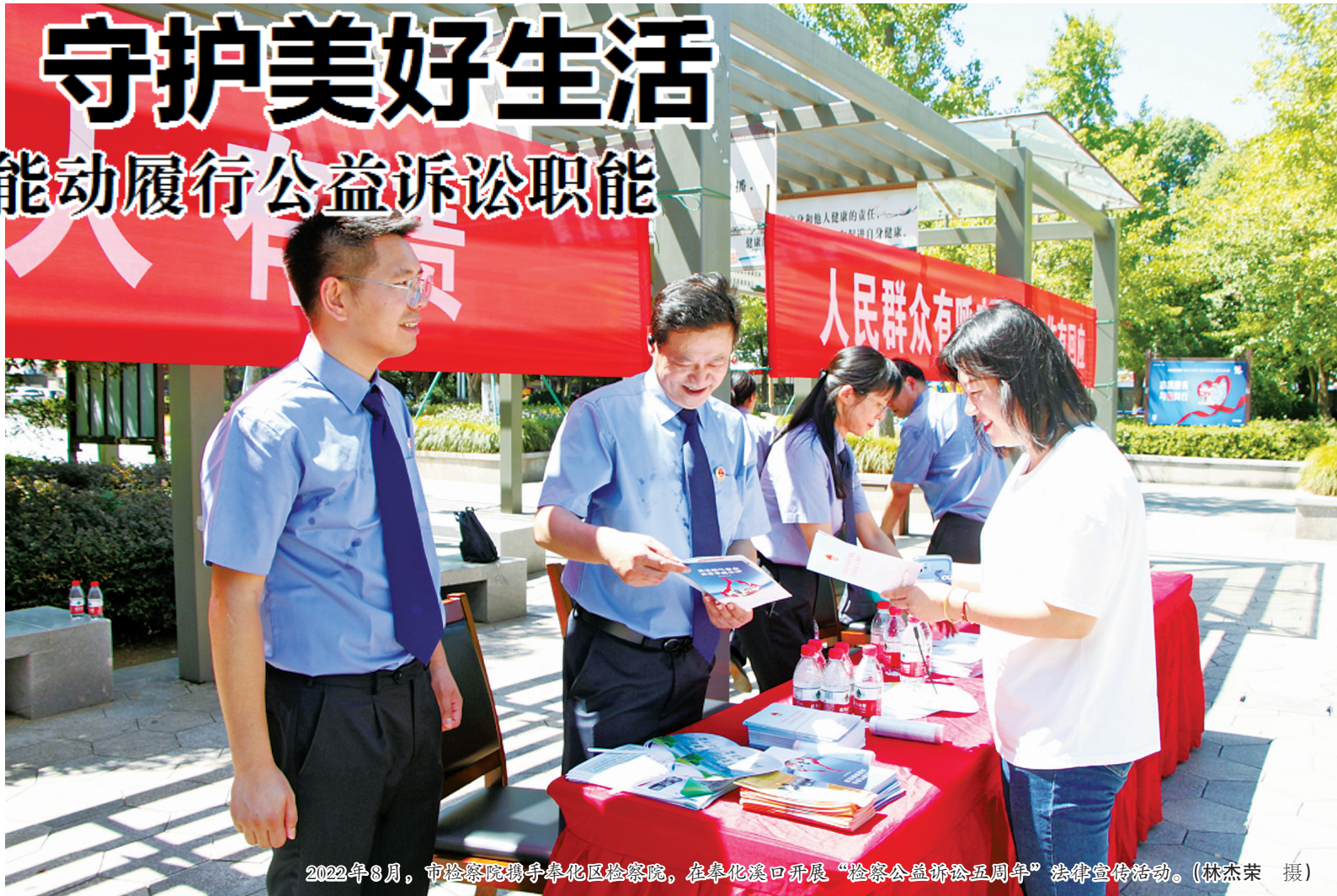
2022年8月，市检察院携手奉化区检察院，在奉化溪口开展“检察公益诉讼五周年”法律宣传活动。

案组审查认为，张某等人销售不具备病毒防御功能的口罩，不仅危及一线抗疫人员，还威胁到一线抗疫人员接触到的大量不特定民众的生命健康安全，极大地增加了感染传播的风险，不利于疫情防控时期公共卫生安全，损害了社会公共利益，根据《中华人民共和国消费者权益