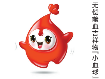
无偿献血吉祥物“小血球”

“小血球”以伸展召唤的手势和奔跑血滴的组合,展现引导更多人参与无偿献血公益活动的形象。头顶以心心相印血滴相连,彰显齐心协力用爱心凝聚血液,用血液凝聚爱心,展示点滴血液之力凝聚更多人参与无偿献血磅礴力量的爱心行动。同时又以流露甜蜜内心(馅汁)的宁