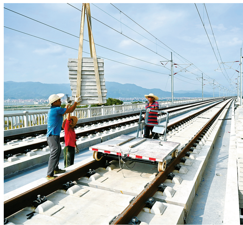
施工人员在新建福厦铁路湄洲湾跨海大桥上作业(9月1日报)。

近日，我国首条跨海高铁——新建福(州)厦(门)铁路铺轨施工全线贯通。目前，铁路沿线站房等工程正加紧建设。