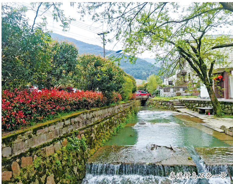
嘉溪村乌石岙一景

称古育王寺。传西晋太康年间，慧达大师在此结茅而居，夜见舍利涌现，于是建寺以奉，是为古育王寺前身。作为阿育王寺发祥之地，乌石岙今尚存“涌见岩”字碑、瑞应亭、慧达大师墓塔等诸多古迹。这些古迹和村周出土的汉代陶罐古物等表明：早在汉晋时期，嘉溪村一带已有先民栖息。唐元和五年，王家人选择把罗氏安葬于“嘉溪村东山之北源”，可能就是认为这一带有宝塔名寺，风水天成，是这位善良夫人最理想的归宿之地吧。