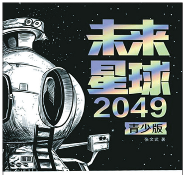
少年，你的火星船票准备好了吗？ 中国科学院激光与智能能量制造团队负责人、中国科学院院士、中国科学院激光与智能能量制造团队负责人……