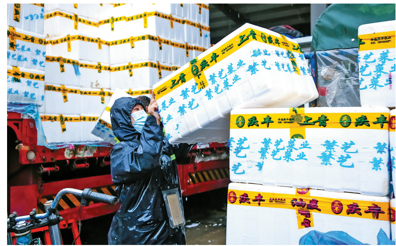
蔬菜批发市场的装卸工正在搬运蔬菜。

本报讯(记者孙佳丽)面对今明的风雨“大考”,宁波市民的“菜篮子”拎得稳不稳?昨日下午,记者从宁波农副产品物流中心获悉,下属蔬菜批发市场蔬菜供应总体平稳。截至昨日15时,市场蔬菜储备量约1550吨,从省外调入在途各类蔬菜约2665吨,保持约610吨耐储存的土豆、洋葱、冬瓜等蔬菜在场,动态储备蔬菜约4215吨。目前,市场内蔬菜已顺利完成交易,全天蔬菜销售3323吨,批发均价为每千克2.3元,“蔬菜价格风