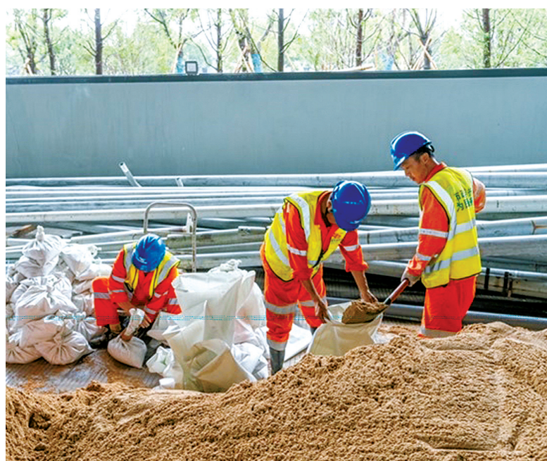
昨日下午,海曙市政工作人员灌装沙袋并送往各易涝点位,全力防台。

安民心。昨天下午1时,三江口江东北路沿江已经提前立起了一米高的挡水板,以防涨潮时江水倒灌。北仑区春晓街道三山村巡查小组在排查隐患时发现,球山社的溢洪道内有许多生活垃圾、杂草和树枝,导致河道堵塞,工作人员用锄头进行了清理,保障河道彻底畅通。昨天17时50分左右,宁海黄坛镇中央山村一处公路遭遇小面积