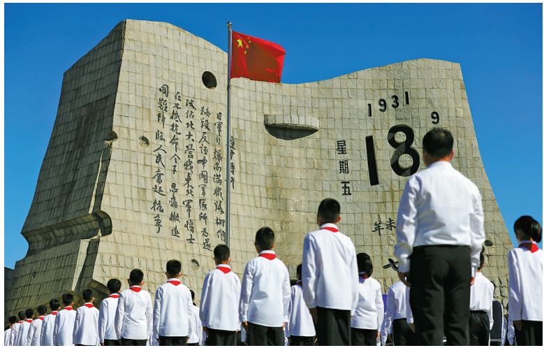
今年是九一八事变爆发91周年。9月18日上午,勿忘九一八撞钟鸣警仪式在沈阳九一八历史博物馆馆前广场举行。(新华社发)