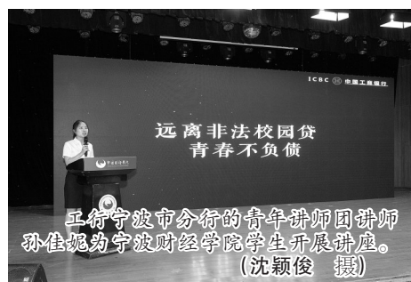
9月23日,由宁波银保监局指导,宁波金融团工委、宁波市银行业协会、宁波市保险行业协会主办,中国工商银行宁波市分行承办的“送金融知识进校园”活动在宁波财经学院举办。