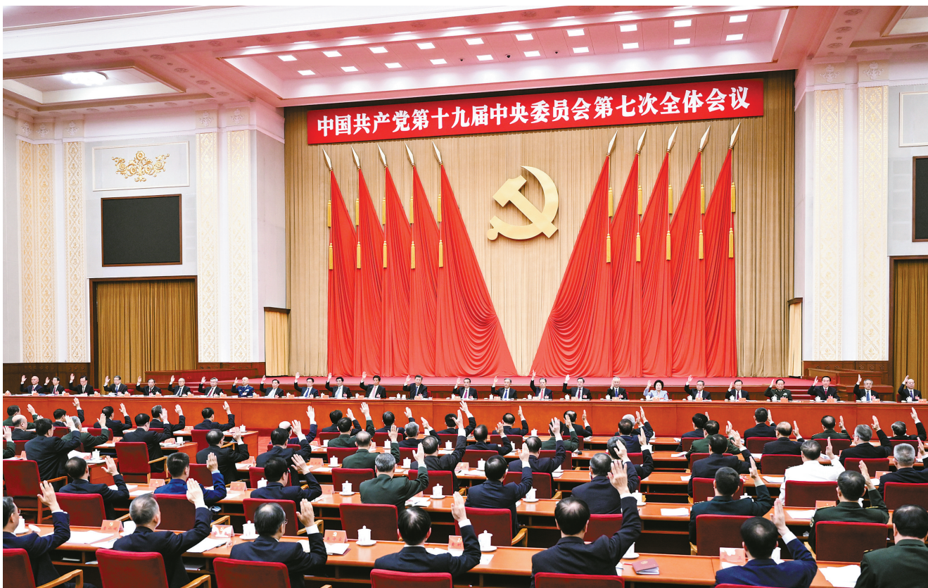
中国共产党第十九届中央委员会第七次全体会议，于2022年10月9日至12日在北京举行。中央政治局主持会议。