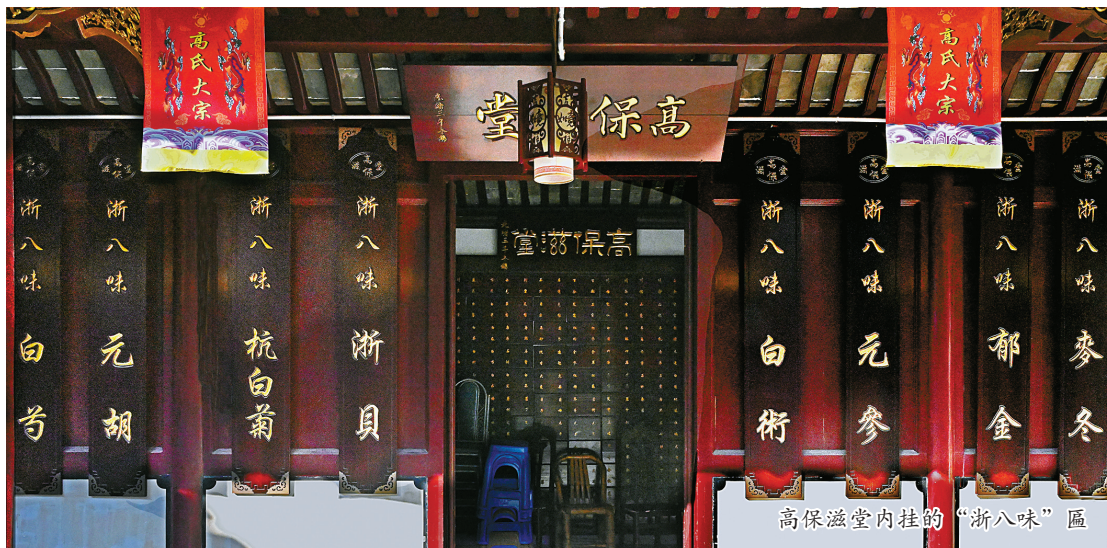
高保滋堂内挂的“浙八味”匾