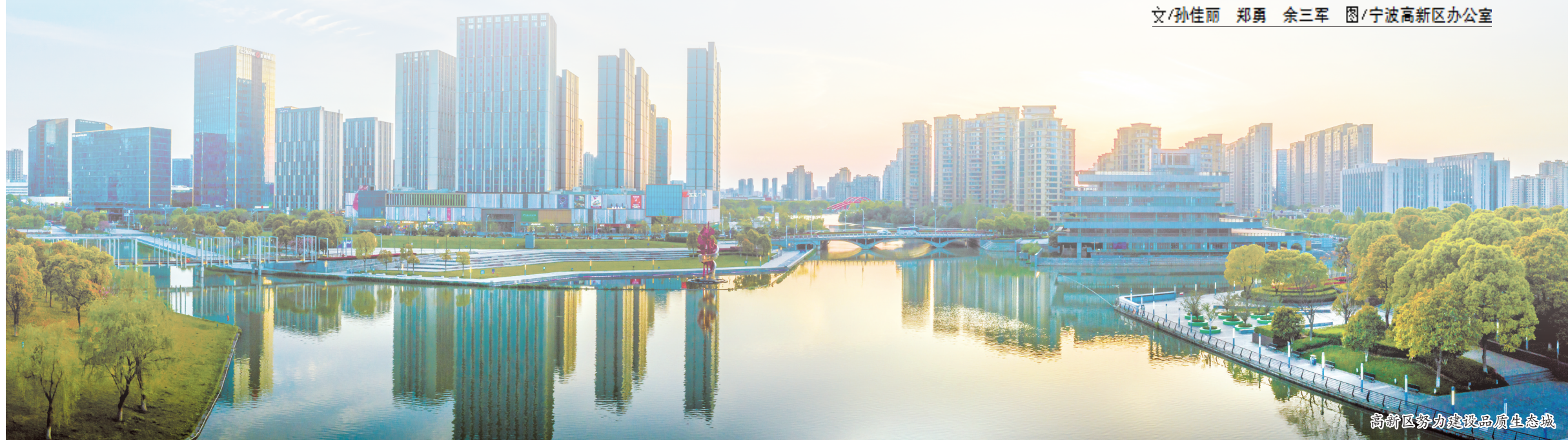
高新区努力建设品质生态城