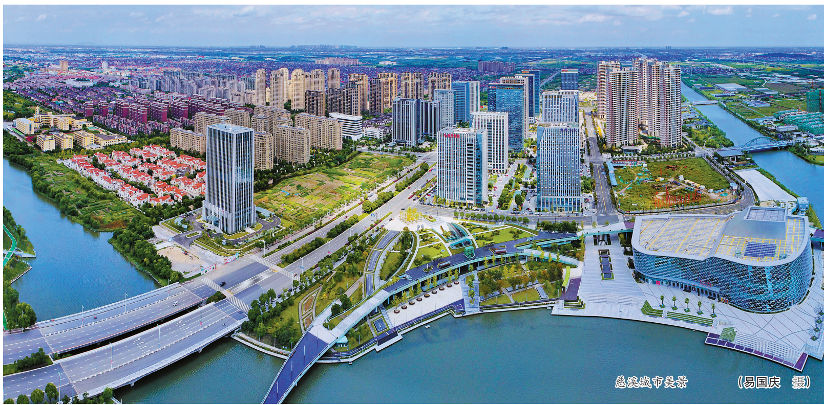
慈溪城市美景

今年以来，慈溪坚持“工业立市、创新强市”战略路径，深入实施“腾笼换鸟”产业治理攻坚、老旧工业区改造提升、工业用地全生命周期管理、先进制造业投资攻坚等行动，稳企助企强主体，稳链保链强动力，强基固本提质效。其间，该市以数字经济赋能制造业质量变革、效率变革、动力变革，着力提升产业链供应链竞争力，制造业高质量发展动能澎湃。 作为宁波发展的重要一极，慈溪努力在建设现代化滨海大都市中展现更大担当作为。“慈溪将强化产业提质升级，加快建设先进智造高地，推动传统制造向现代智造迭代、块状经济向产业集群迭代、工业大市向质量名城迭代，奋力打造现代化滨海大都市北部智造名城。”该市相关负责人说。