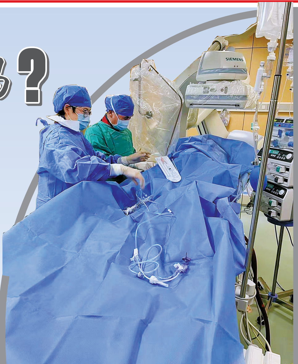
医生正在为病人施行冠脉造影手术。

采访中，专业人士忧心忡忡地说，目前，我国男科正处于发展阶段，和妇科相比，男科发展相对滞后。医科大学未设立男科专业，缺乏专门的男科教材；三甲医院鲜有开设男科中心或男科门诊，我市至今仅有5家公立医院开设男科门诊，这一现状与男科的巨大需求明显不符。“专业男科人才匮乏和人才培养薄弱，将在一段时间内牵制男科发展。”不过，专业人士也相信，医院开设男科中心或成立独立男科，必然是大势所趋。