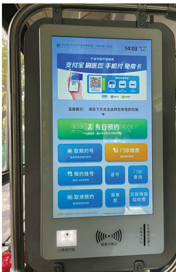
健康巴士上的车载自助机。

目前，车载自助机提供预约挂号、取号、缴费、检验报告单查询、退号等多项功能。自助服务支持医保卡及电子医保凭证、电子健康卡等。操作方式与医院里的自助机完全一致。来院市民在车上完成预约挂号、取号，入院后即可直接到相应诊室签到候诊。