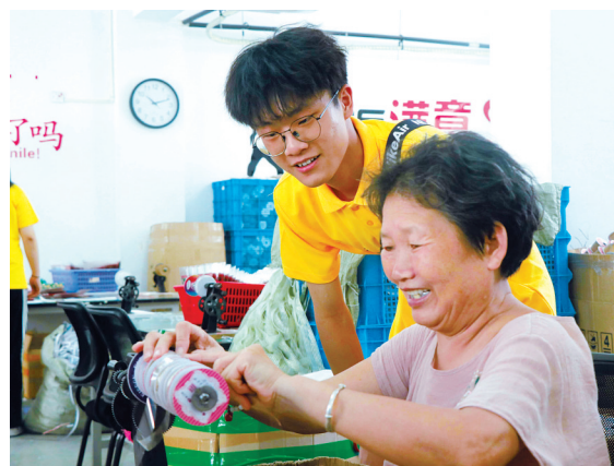
实践团队成员采访社区居民。

“我们希望引导和帮助广大青年认真学习贯彻习近平总书记关于青年工作的重要思想,上好与现实相结合的‘大思政课’,在社会课堂中受教育、长才干、作贡献,在观察实践中坚定信念听党话、跟党走,在加快建设现代化滨海大都市的进程中努力绽放夺目的青春之光。”主办方相关工作人员说。