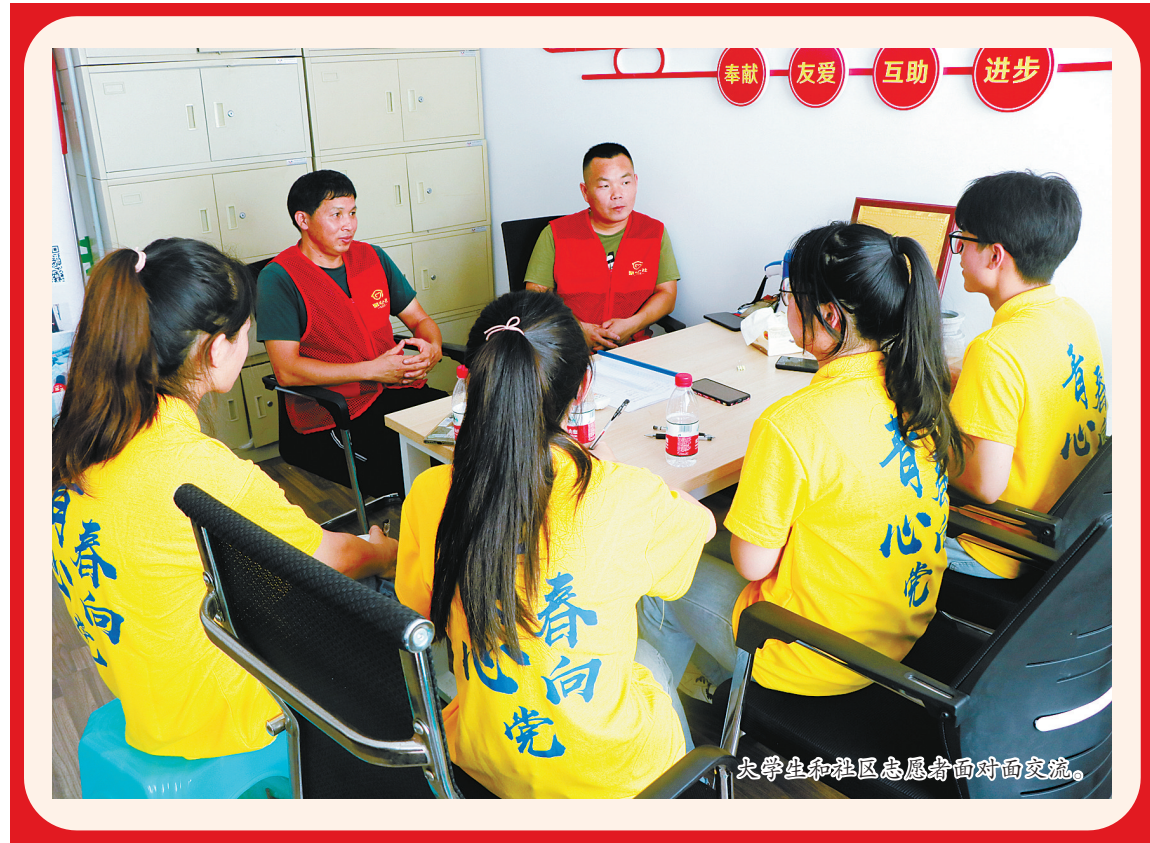
大学生和社区志愿者面对面交流。

如何更好地激励广大青年在火热实践中贡献光与热?1997年以来,依托宁波大中专学生暑期社会实践活动这一载体,一批又一批的甬城学子在经济社会发展的第一线摸爬滚打,向实践学习、向人民学习,在奉献社会、服务他人中增本