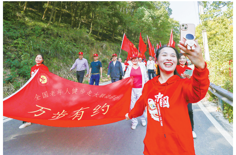
昨日,在海曙区集士港镇深溪村,全国老年人健步走大联动(海曙分会场)活动火热举行。来自我市的200名老年徒步爱好者激情满怀,从深溪村文化礼堂出发一路沿着龙鹭登山步道前行,顺利完成5公里的徒步活动。