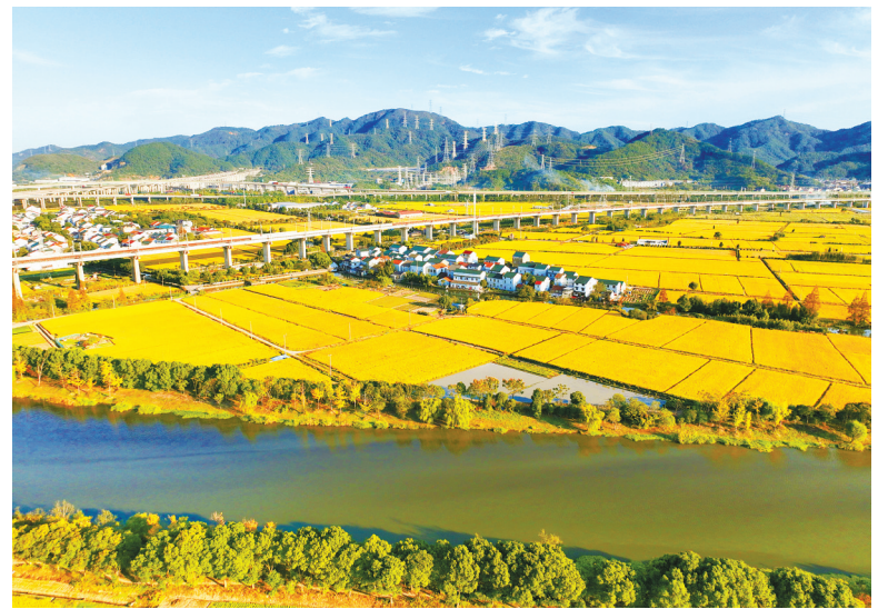
昨日,在北仑小港街道的农田里,放眼望去金灿灿的稻谷和湛蓝的天空相映衬,构成了这个时节一道亮丽的风景。