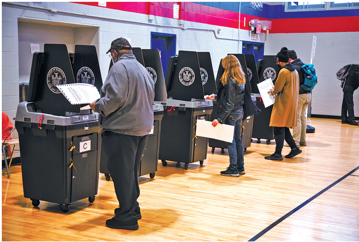
11月8日，选民在美国纽约的一处投票站参加中期选举投票。