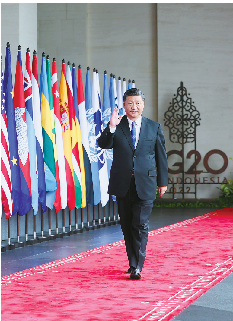
当地时间11月15日，二十国集团领导人第十七次峰会在印度尼西亚巴厘岛举行。国家主席习近平出席并发表题为《共迎时代挑战 共建美好未来》的重要讲话。这是习近平步入会场。