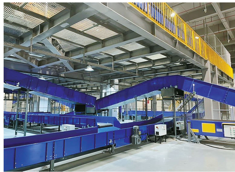
1号楼为邮检作业场地。

2016年以来，宁波国际邮件互换局累计服务跨境电商及出口企业超2000家，通关进出口邮件5545万件，出口跨境电商货值8694万元。但随着跨境电商等外贸新业态的蓬勃发展，原有场地规模和面积无法满足快速增长的业务需要。于是在2019年，宁波国际邮件互换中心新场地开工建设，去年底竣工验收，总建筑面积是原有场地的5倍多。