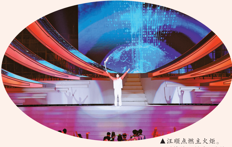
▲汪顺点燃主火炬。

另外，昨天下午，浙江省体育局对2018-2021年度浙江省群众体育工作成绩突出集体和个人进行了表彰，宁波市全民健身指导中心等11个单位和宁波的闻蓉等18名个人榜上有名。