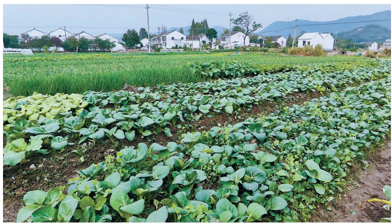
周村菜园。