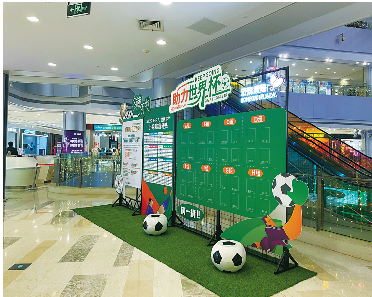
图为宁波阪急广场内的助力世界杯快活动。

本报讯（记者孙佳丽）前天，随着关于调整全市常态化疫情防控措施的通知发布，宁波各大商场、步行街纷纷推出2022卡塔尔世界杯吃喝玩乐方案。