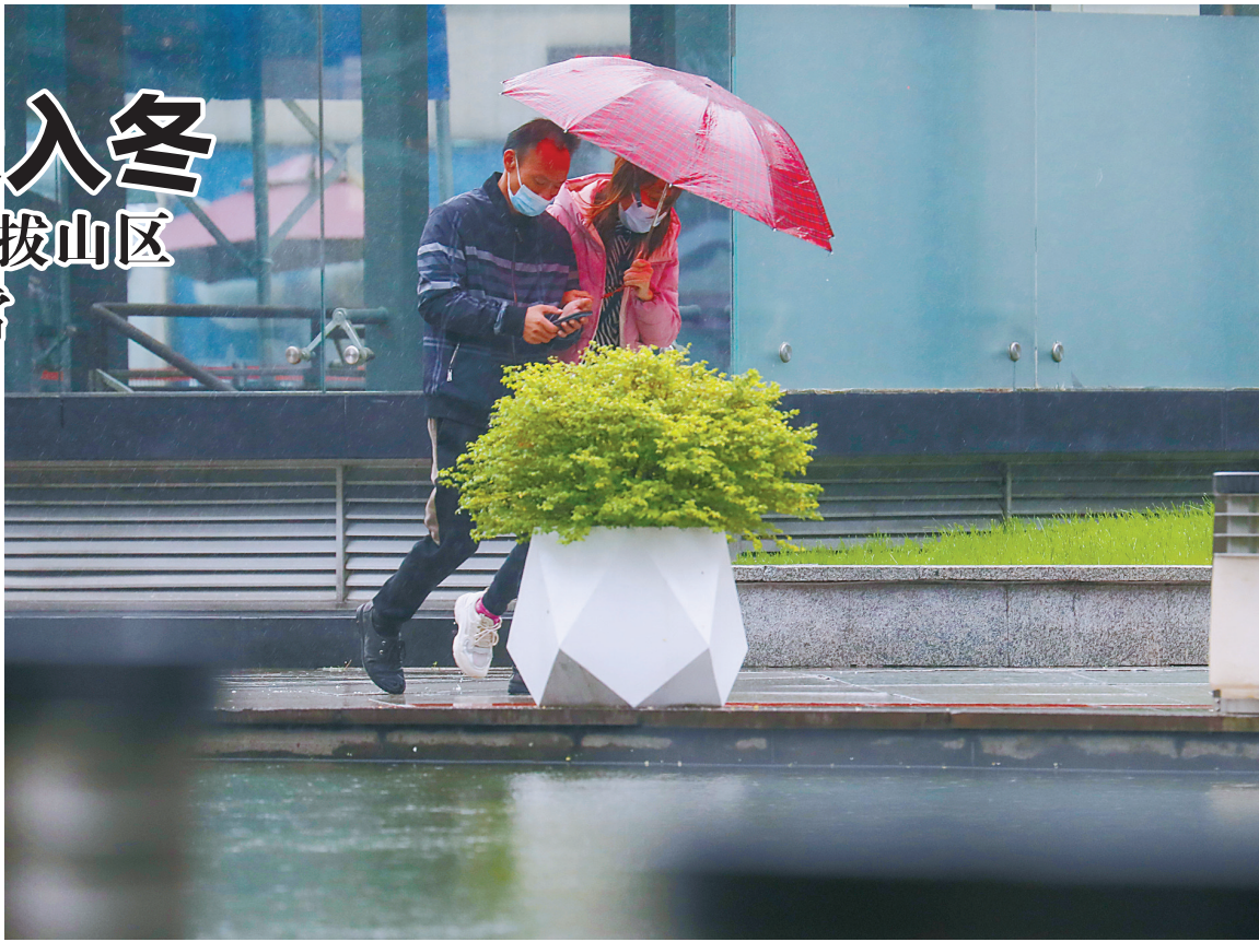
昨天下午,市民顶着风雨行走在天一商圈。