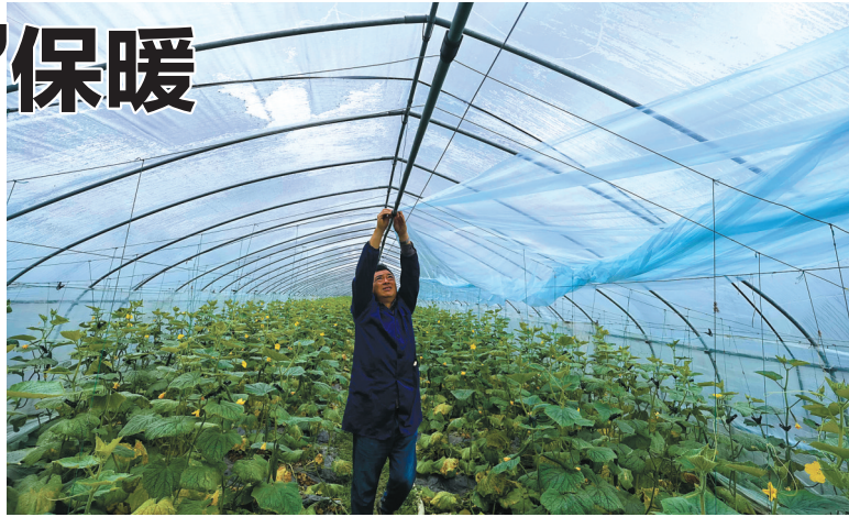
农户忙着盖膜保温。

果气温继续下降,他们还将采用“熏烟增温”防冻技术,将冻害影响降到最低。 据了解,水果番茄、黄瓜等瓜类作物适宜生长温度在10℃至30℃之间。如果室外温度降到10℃以下,加盖一层膜,棚内温度能保持在15℃以上;如果再加盖一层膜,棚内温度能保持在20℃以上,这样的温度就不会影响农作物的生长和产量。