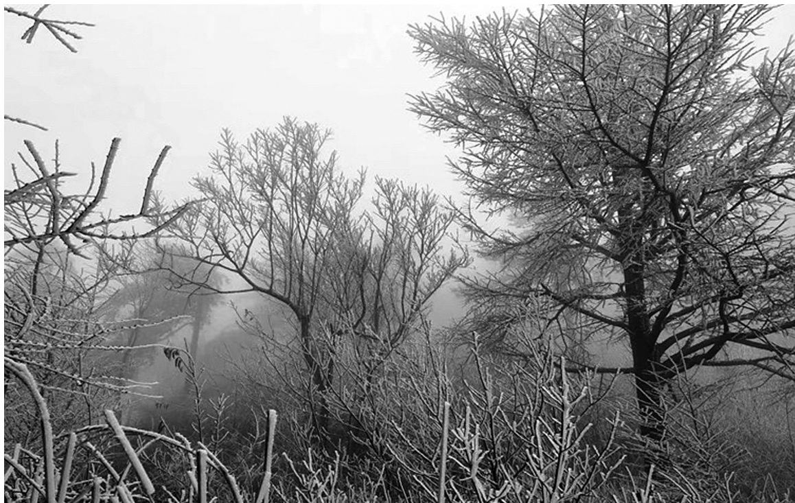
昨天宁波一入冬,商量岗就迎来了首场雾凇。